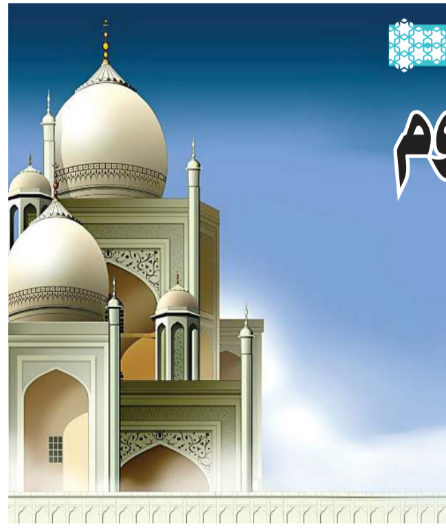
مقتطفات من محاضرات القيت في مسجد ناظمة الجسار

«اللهم اجعل القرآن الكريم ربيع قلوبنا، ونور أبصارنا، وشفاء صدورنا وجلاء أحزاننا، وذهاب همومنا وغمومنا، ودليلنا إليك وإلى جناتك جنات التعيم برحمتك يا أرحم الراحمين»