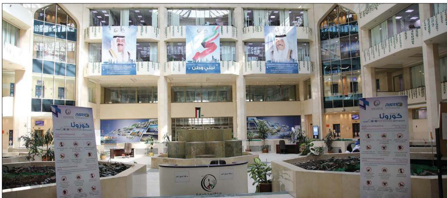
ملصقات توعية تعريف موظفي «الأشغال» بسبل مواجهة فيروس كورونا