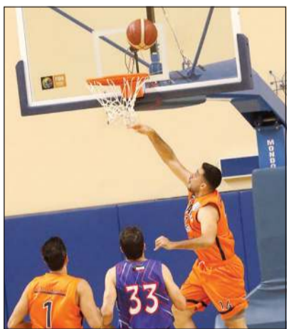
جانب من مواجهة كاطمة والشباب في تمهيدي الكأس

حجز الفريق الأول لكرة السلة بنادي كاطمة مقعده أولا في الدور ربع النهائي لكأس الاتحاد لكرة السلة في نسخته الـ 59 في الموسم 2020-2021، وذلك بعد تغلبه على الشباب 92-84 نقطة، في أولى مباريات الكأس. هذا، وتختتم في 6:30 مساء اليوم مواجهات الدور التمهيدي للكأس بمباراة صعبة وتنافسية بين الجهراء رابع ترتيب الدوري الممتاز، وبرقان أول فرق دوري الدرجة الأولى، وذلك على صالة الاتحاد بمجمع الشيخ سعد العبدالله للصالات.