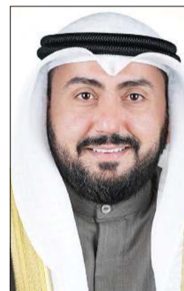
الشيخ دباس الصباح