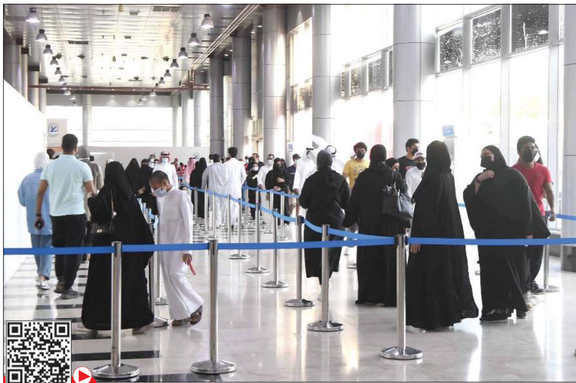
إقبال كبير على تلقي اللقاحات المضادة لفيروس كورونا في مركز الكويت للتطعيم