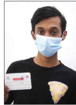
نسبة كبيرة من المراجعين في المركز من الشباب