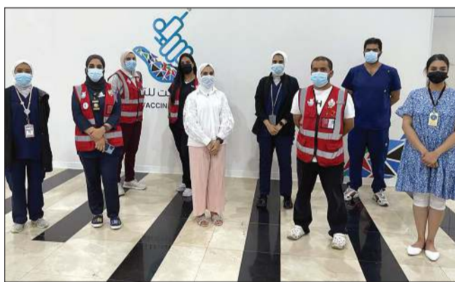
من فريق العمل في مركز الكويت للتطعيم

وتوجهت أم مشاري بالشكر لجميع العاملين بالصفوف الأمامية، سواء من وزارة الصحة أو الداخلية والدفاع، وحكومتنا الرشيدة، سائلة من الله عز وجل أن يحفظ بلادنا