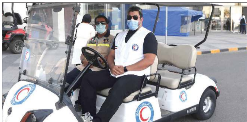
«الهلال الأحمر»، تقدم العون للمراجعين بالمركز