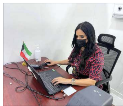
نعود المشعان من فريق مركز التطعيم ودعم متلقي اللقاح

مشيدة بجهود المنظمين في مركز الكويت للتطعيم وتعاملهم السريع مع المراجعين لأخذ الجرعات بكل يسر وسهولة، مبيته أنها أخذت التطعيم للسفر وحماية نفسها.