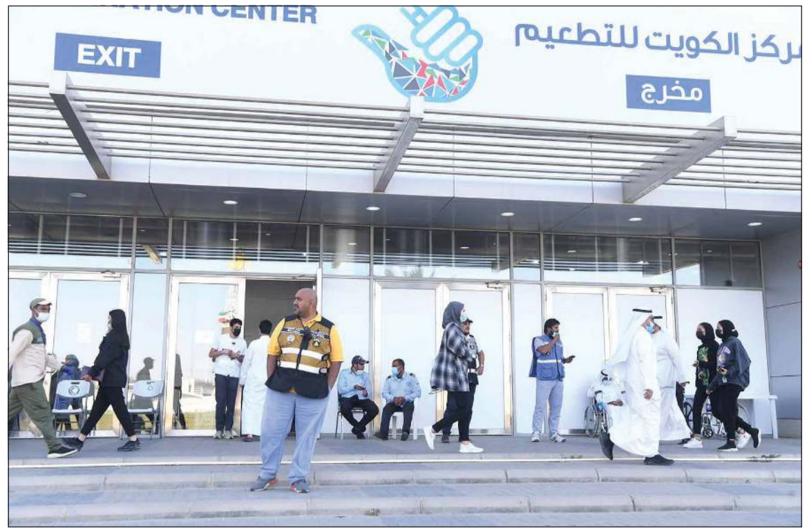
مركز التطعيم يستقبل متلقي اللقاح من جميع الأعمار (محمد هاشم)