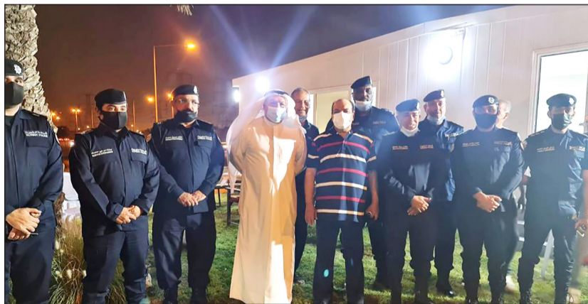
الواء م.محمود بوشهري والفريق م. عبدالفتاح العلي مع رجال «الدخيلة»، بإحدى النقاط الأمنية

الحفاظ على سلامة المواطنين والمقيمين. وشدد بو شهري على ضرورة تفويت الفرصة على كل من يحاول الانتفا على القرارات الصادرة من مجلس الوزراء وإحالة المخالفين إلى جهات التحقيق إذا ما عمدوا الى كسر قرار الحظر. وأشاد بالدور الحيوي لرجال الامن ومواصلتهم الليل بالنهار من أجل راحة المواطنين والمقيمين وتحليلهم بالصبر في التعامل مع الجميع من خلال تواجدهم بالشارع على مدار الساعة.