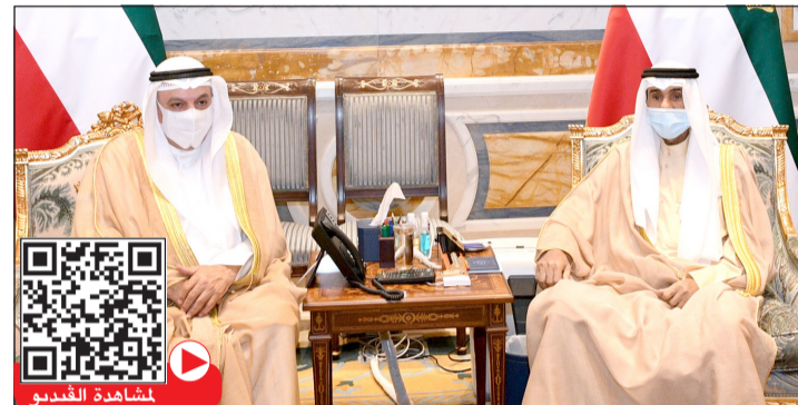
صاحب السمو الأمير الشيخ نواف الأحمد مستقبلاً رئيس ديوان المحاسبة فيصل الشايح

الشيخ نواف الأحمد بريقة تهنئة إلى الرئيسة فيوسا عثمانى الرئيسة المنتخبة لجمهورية كوسوفو الصديقة، عبر فيها سموه عن خالص تهانئه بمناسبة انتخابها رئيسة للجمهورية، متمنيا سموه لها كل التوفيق والسداد وموفور الصحة والعافية وللعلاقات الطيبة بين البلدين الصديقين المزيد من التطور والنماء. وبعث سمو ولي العهد الشيخ مشعل الأحمد بريقة تهنئة إلى الرئيسة المنتخبة فيوسا عثمانى، ضمنها سموه خالص تهانئه بمناسبة انتخابها رئيسة لجمهورية كوسوفو الصديقة، متمنيا سموه لها كل التوفيق والسداد.