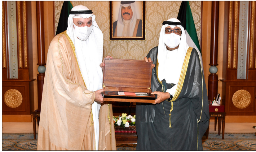
سمو ولي العهد الشيخ مشعل الأحمد مستقبلاً رئيس ديوان المحاسبة فيصل الشايح

استقبل سمو ولي العهد الشيخ مشعل الأحمد بقصر بيان صباح أمس رئيس مجلس الوزراء سمو الشيخ صباح خالد، ورئيس مجلس الأمانة مرزوق الغانم، كما استقبل سموه رئيس ديوان المحاسبة فيصل فهد الشايح، حيث قدم لسموه نسخة من تقرير المواطن 2020.