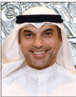
السفير علي الظفيري

تدشين مركز صحي متكامل في ولاية جندوبة شمال تونس على نفقة القطاع الأهلي الكويتي.