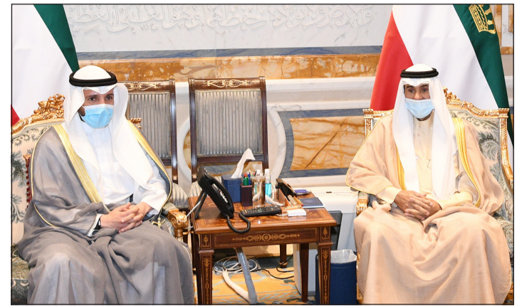
صاحب السمو الأمير الشيخ نواف الأحمد مستقبلاً رئيس مجلس الأمة مرزوق الغانم