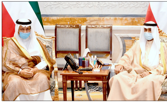
صاحب السمو الأمير الشيخ نواف الأحمد مستقبلاً سمو الشيخ جابر المبارك

حفاظ مبارك الكبير متوسطا عددا من رجال الامن