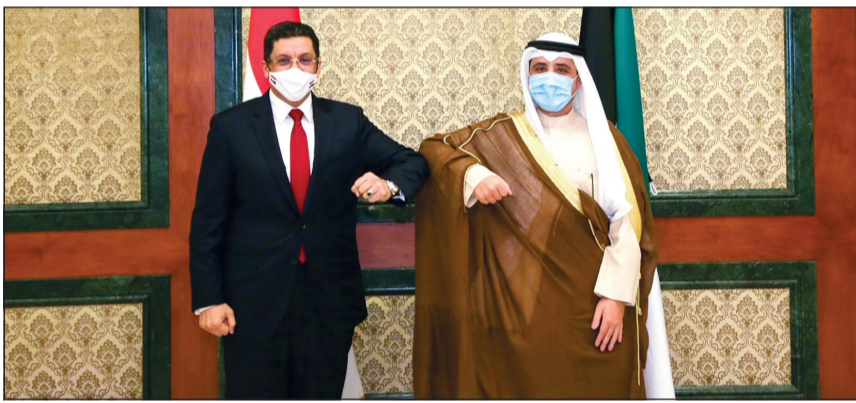
الشيخ د.أحمد ناصر المحمد خلال استقبال وزير الخارجية اليمني د.أحمد بن مبارك

التي تنفذها الميليشيات الحوثية والتي تستهدف الضواحي والمنشآت المدنية في اليمن وفي المملكة العربية السعودية الشقيقة الأمر الذي يعد تهديدا مباشرا للأمن القومي الخليجي والعربي. شرحا عن آخر المستجدات الحاصلة في اليمن، معربا عن بالغ الثناء والتقدير لدور الكويت وإسهاماتها نحو دعم أشقاها في اليمن خاصة على الصعيد الإنساني ولمساعيها الرامية إلى تحقيق الأمن والاستقرار وتخفيف المعاناة الإنسانية التي يعيشها الشعب اليمني الشقيق.