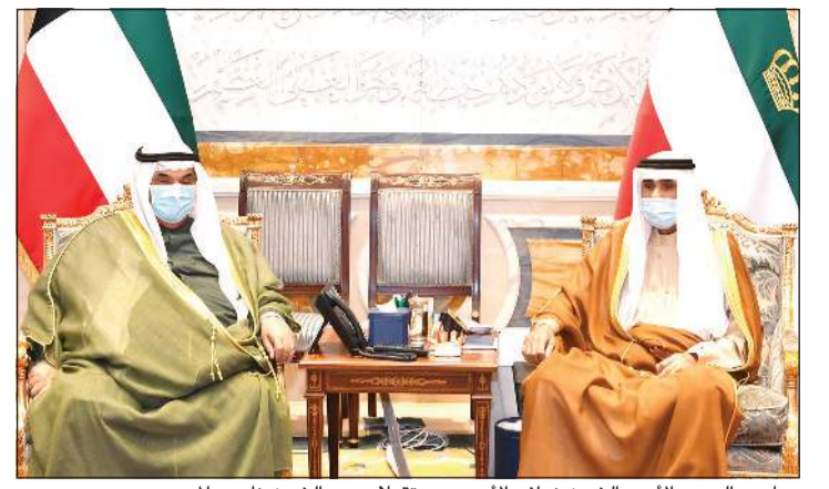
صاحب السمو الأمير الشيخ نواف الأحمد مستقبلاً سمو الشيخ ناصر المحمد