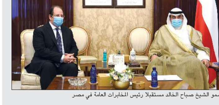
سمو الشيخ صباح خالد مستقبلاً رئيس المخابرات العامة في مصر

استقبل سمو رئيس مجلس الوزراء الشيخ صباح خالد وبحضور وزير الإعلام والثقافة وزير الدولة لشؤون الشباب عبدالرحمن المطيري في قصر بيان أمس رئيسة مركز العمل التطوعي الشيخة أمثال الأحمد وأعضاء الفريق لسموه شرحاً حول الاستراتيجية الوطنية للعمل التطوعي والتي تهدف إلى تنظيم ودعم العمل التطوعي في البلاد. وأعد سموه عن شكره وتقديره لرئيسة وأعضاء الفريق للجهود المبذولة في إصدار الاستراتيجية الوطنية للعمل التطوعي، مؤكداً أهمية تنظيم العمل التطوعي واستثماره في تعزيز قدرات الشباب الكويتي وتنمية الشعور بالمسؤولية تجاه وطنهم، ومشيداً بجهود الفرق التطوعية وعملها الدؤوب خاصة خلال أزمة انتشار فيروس كورونا ومساهمتها الكبيرة في دعم ومساندة مختلف أجهزة الدولة. من جهة أخرى، أكد سمو رئيس مجلس الوزراء الشيخ صباح خالد أن طولة البال وسعة الصدر تحل أموراً كثيرة، وهذا منهج تعلمته من عمى سمو الشيخ سالم العلي، مضيفاً: ان الشعب الكويتي يستاهل أن نخفف عليه من أعبائه في تأجيل الأقساط عن المواطنين لسنة أشهر، وان القادم سيكون أفضل بإذن الله تعالى. جاء ذلك خلال استقباله لرئيس