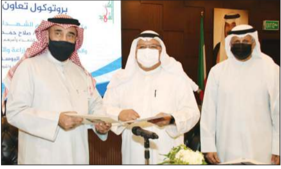
الشيخ علي الجراح خلال تبادل الاتفاقية مع الشيخ محمد اليوسف

وقّع وزير شؤون الديوان الأميري الشيخ علي الجراح بروتوكول تعاون مع الهيئة العامة للزراعة والثروة السمكية لتسليم الهيئة 50 حديقة عامة للمكتب بهدف تغيير أسمائها إلى أسماء شهداء المنطقة الواقعة بها الحديقة والمعتمدين لديهم من مواطنين ومقيمين. وقال مدير مكتب تكريم الشهداء صلاح العوفان أنه تقديراً من الدولة لتضحيات شهدائها فقد تقرر وضع مجسم للشهيد في الحديقة العامة للمنطقة تحتوي على صورة الشهيد وحنديتات استشهاده مؤكداً أن هناك باركود خاصاً في الجسم يمكن للزائر من خلاله البحث عن المعلومات المذكورة عن الشهيد