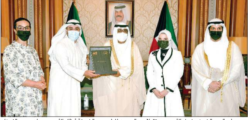
سمو ولي العهد الشيخ مشعل الأحمد مستقبلاً عبدالرحمن المطيري والشيخة أمثال الأحمد وروان يعرب الفوزان ومحمد ناصر العطوان

في نشر ثقافة المبادرات الإنسانية حول العالم، مؤكداً سموه أن هذا العمل لهو فخر واعتزاز لكل شباب الكويت وأن القيادة السياسية تولي كل الاهتمام بالعمل الخيري التطوعي والمتجذّر بتاريخ الكويت منذ نشأتها، مطالبا سموه أبناءه بأن يبرزوا للعالم الصورة المشرفة للإنسان الكويتي الذي يتمتع بثقافة إنسانية نابعة من أصول وقيم ديننا الحنيف. كما استقبل سمو ولي العهد الشيخ مشعل الأحمد، حفظه الله بقصر بيان صباح امس، محافظ بنك الكويت المركزي د.محمد الهاشل.