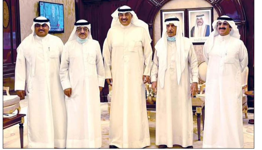
سمو الشيخ صباح خالد متوسلاً رئيس ملتقى الجهراء مشعل عثمان السعيد وأعضاء الملتقى