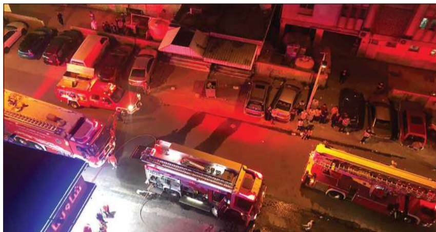
«الإطفاء» أخلت البناية من قاطنيها

بقوة الإطفاء العام أن غرفة العمليات تلقت بلاغا يفيد بنشوب حريق في عمارة مكونة من 8 أدوار وعلى اثره تم توجيه فرق الإطفاء من مراكز الفروانية وجلب الشيوخ والإنتقاذ الفتي، وتبين أن الحريق بالدور السادس وهناك أشخاص محتجزون. وأضافت الإدارة أن فرق الإطفاء قامت بإخلاء العمارة من السكان وتمكنت من السيطرة على الحريق، فيما باشرت فرق التحقيق عملها لمعرفة أسباب الحادث.