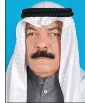
الفريق م. عبدالفتاح العلي

كشف عضو لجنة الاشتراطات الصحية الفريق م. عبدالفتاح العلي لـ «الانباء» عن أن الحملات التي جرى تنفيذها على مدار الأسابيع الأخيرة أظهرت أن بعض المزارع والجواخير والتي تعد أملاك دولة تحولت إلى فنادق 7 نجوم، وتفتتح أبوابها لإقامة حفلات وأعراس صالها، وهو ما يشكل تجاوزا صارخا للقانون وباعتبارها أملاك دولة وليست أملاك خاصة، لافتا إلى انه تم الاتفاق مع الهيئة العامة للزراعة ووزارة الكهرباء لمرافقة الفرق تمهيدا لقطع التيار الكهربائي عن المنشآت المخالفة واتخاذ الإجراءات القانونية بحق أصحابها كونها تسهم في ارتفاع أعداد المصابين بـفيروس كورونا، مضيفا: للأسف وخلال رصدنا لكل المنشآت تبين لنا «ان ريمة رجعت لعادتها القديمة»، وهناك عدم التزام من شرائح عمرية تعتقد