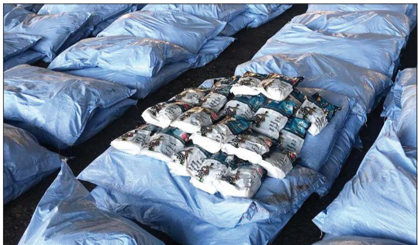
أكياس التنباك بعد استخراجها من البطانيات

ميناة الشعبية من إحدى الدول الآسيوية، وكانت تحوي بضاعة بطانيات وأكياس قمامة، ومن خلال رصد وتتبع الشحنة من قبل رجال البحث والتحري، وبناء عليه تم تفتيش الحاوية والعمود على 330 ألف كيس من مادة التنباك الممنوع استيرادها بحسب القوانين الجمركية الصادرة بهذا الشأن تبعا لتعليمات وزارتي التجارة والصحة، وتم اتخاذ الإجراءات الجمركية اللازمة.