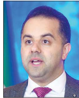
د. عبدالله السند

تتلقى الرعاية الطبية اللازمة 14263 حالة. وأفاد بأن عدد المسحات التي تم إجراؤها في الساعات الـ24 الماضية بلغ 9494 مسحة، ليبلغ مجموع الفحوصات 2047293 فحوصاً، مشيراً إلى أن نسبة الإصابات لعدم المسحات خلال الـ24 ساعة الماضية بلغت 13.4٪. ووجد دعوة المواطنين والمقيمين لمداومة الأخذ بسبل الوقاية كافة وتجنب مخالطة الآخرين والحرص على تطبيق استراتيجية التباعد البدني، موصياً الجميع بزيارة الحسابات الرسمية لوزارة الصحة والجهات الرسمية في الدولة للاطلاع على الإرشادات والتوصيات، وكل ما من شأنه الإسهام في احتواء انتشار الفيروس.