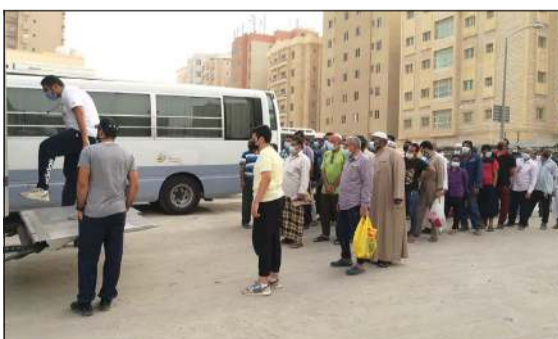
توزيع السلال على المتضررين من «كورونا»