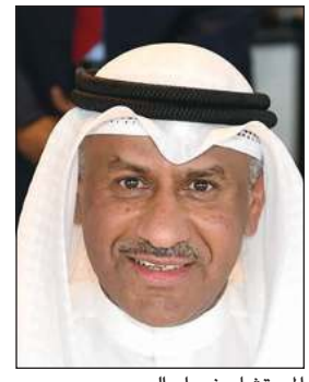
المستشار ضرار العسوسي

94%، وأعرب النائب العام عن استهتار ضرار العسوسي في مكتبة صباح الأحد الماضي مدراء النيابة الجزئية، وذلك بحضور المحامين العاملين. وأثنى العسوسي على جهودهم المتميزة التي بذلها خلال عام 2020 التي أظهرت نتائجها الإحصائية السنوية للنيابة العامة لهذا العام، إذ ورد للنيابة العامة 23613 قضية تم إنجاز 22238 قضية منها، بنسبة إنجاز بلغت