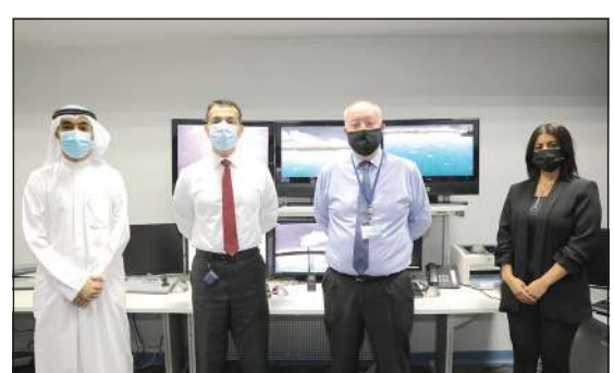
إدارة قسم الملاحة البحرية في الكلية الأسترالية بالكويت

والتخصص أيضاً أهمية ثانية وهي توفير التدريب والتعليم المطلوب للدخول البحرية بحيث يستطيع الخريجون العمل كضباط على متن السفن التجارية، ويتكون برنامج دبلوم العلوم البحرية من 4 فصول دراسية على مدى سنتين. ويقدم هذا التخصص أساسيات العلوم