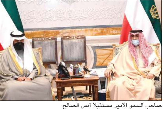
صاحب السمو الأمير مستقبلاً أنس الصالح

كما استقبل صاحب السمو الأمير الشيخ نواف الأحمد بقصر بيان نائب رئيس مجلس الوزراء وزير الدولة لشؤون مجلس الوزراء السابق أنس الصالح. وقد أشاد سموه بأدائه لمسؤولياته بكل إخلاص وتفان، معرباً سموه عن شكره وتقديره له على ما بذله من جهد وعطاء لمصلحة وطنه، وذلك خلال فترة توليه منصبه الوزاري، متمنياً سموه له دوام التوفيق والسداد.