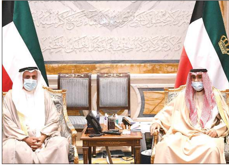
صاحب السمو الأمير مستقبلاً عبدالله الرومي