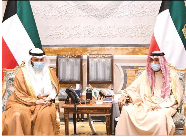
صاحب السمو الأمير مستقبلاً رئيس مجلس الأمة مرزوق الغانم