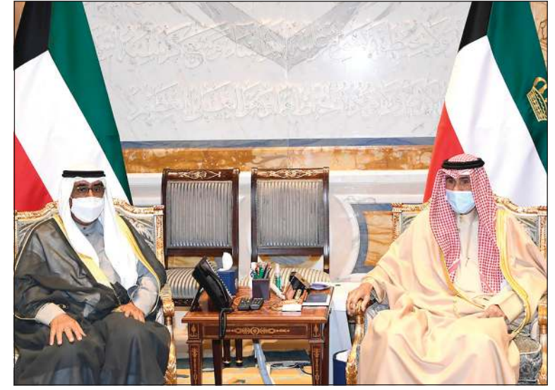
صاحب السمو الأمير الشيخ نواف الأحمد مستقبلاً سمو ولي العهد الشيخ مشعل الأحمد