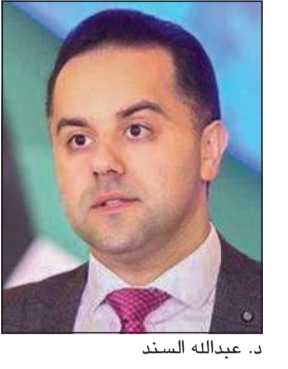
د. عبدالله السند

أعلن المتحدث الرسمي باسم وزارة الصحة د.عبدالله السند أمس السبت تسجيل 1198 إصابة جديدة بفيروس كورونا المستجد (كوفيد-19) في الساعات الـ 24 الماضية، ليرتفع بذلك إجمالي عدد الحالات المسجلة في البلاد إلى 227178 حالة، فيما سجلت 9 حالات وفاة ليصبح مجموع حالات الوفاة المسجلة حتى أمس 1279 حالة. وأضاف السند لـ «كونا» أنه تم تسجيل 1336 حالة شفاء من الإصابة بـ (كوفيد-19) في الساعات الـ 24 الماضية، ليرتفع بذلك إجمالي عدد المتعافين في البلاد إلى 211360 حالة. وأوضح أنه تأكد تماثل تلك الحالات للشفاء بعد إجراء الفحوصات الطبية اللازمة