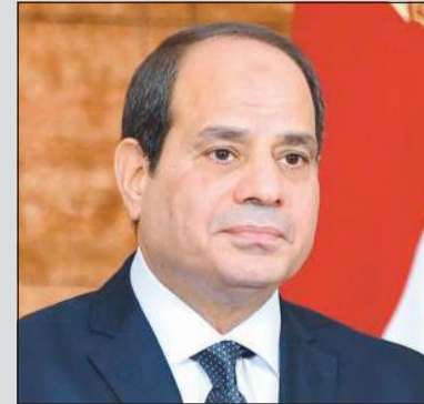
الرئيس المصري عبدالفتاح السيسي