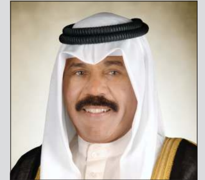
صاحب السمو الأمير الشيخ نواف الأحمد

صاحب السمو عزي الرئيس المصري بضحيا قطاري سوهاج 20