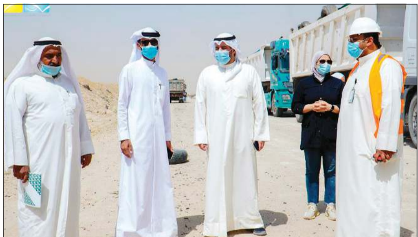
الشيخ عبدالله الأحمد خلال جولته التفقدية لمتابعة نقل إطارات «رحية»

نعمل على تحسين الأوضاع البيئية والمساهمة في إعادة تدوير المخلفات