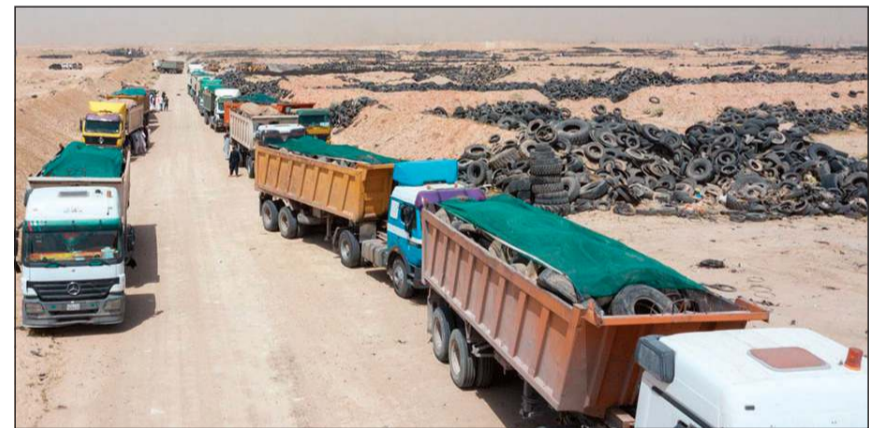
جانب من عمليات نقل إطارات «رحية»