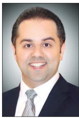
د. عبدالله السند

أعلنت وزارة الصحة أمس الثلاثاء تسجيل 1314 إصابة جديدة بفيروس كورونا المستجد (كوفيد-19) في الساعات الـ 24 الماضية، ليرتفع بذلك إجمالي عدد الحالات المسجلة في البلاد إلى 212169 حالة، في حين تم تسجيل 7 حالات وفاة ليصبح مجموع حالات الوفاة المسجلة حتى أمس 1186 حالة. وقال المتحدث الرسمي باسم الوزارة د.عبدالله السند لـ «كونا» إن عدد من يتلقى الرعاية الطبية في أقسام العناية المركزة بلغ 215 حالة، ليصبح بذلك المجموع الكلي للحالات التي ثبتت