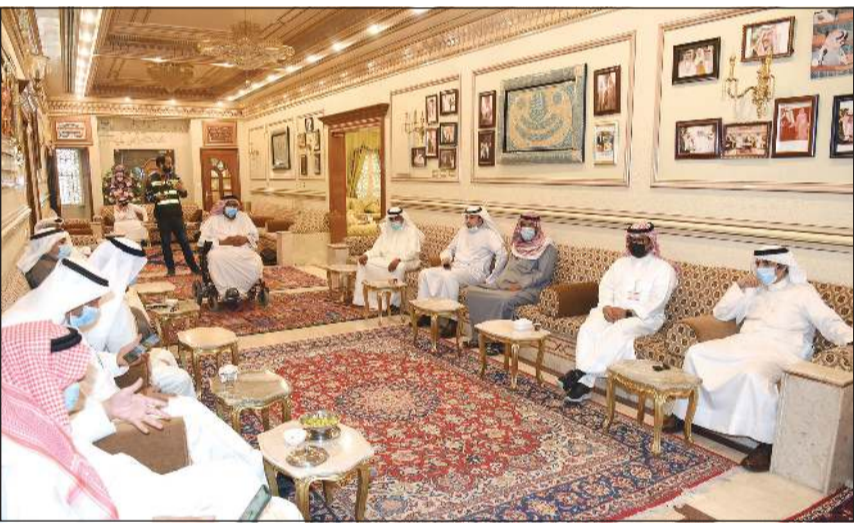
جانب من الحضور في ديوان السعيد

السريع إن وزارة الداخلية حرصت على تطبيق قرار مجلس الوزراء ووزارة الصحة بفرض الحظر، مؤكداً أن هناك 250 قضية سجلت كسر حظر حسب إحصائية