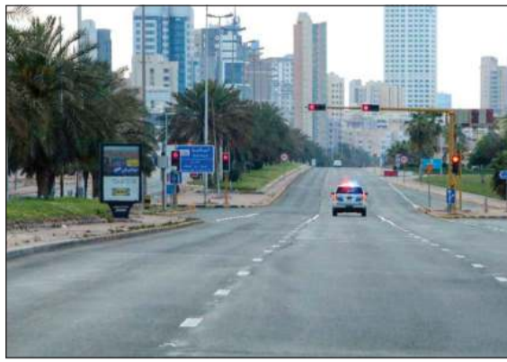
الحظر الجزئي انزل بالمخالفات المرورية

وكشفت الإحصائية الجديدة أن رجال العمليات حرروا 4308 مخالفات وأحالوا 3 إلى النظارة وضبطوا 5 مطلوبين أما رجال مرور العاصمة فحرروا 3795 مخالفة وأحالوا مخالفاً للنظارة، أما رجال مرور حولي فحرروا 4662 مخالفة وأحالوا 2 إلى النظارة، فيما حرر رجال مرور الفروانية 4110 مخالفة وأحالوا مخالفين للنظارة وضبطوا حدثاً، أما رجال مرور الأحمدى فضبطوا حدثاً بلا رخصة سوق وحرروا 2652 مخالفة، فيما أوقف رجال مرور الجهراء 8 أحداث وأحالوا 10 مخالفين إلى النظارة وحرروا 2765 مخالفة، فيما أوقف رجال مرور مبارك الكبير حدثين وحرروا 557 مخالفة، وأخيراً حرر رجال المهام 362 مخالفة.