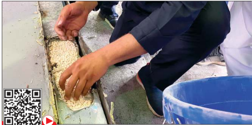
الحبوب أخفيت في جهاز لتفقيس البيض