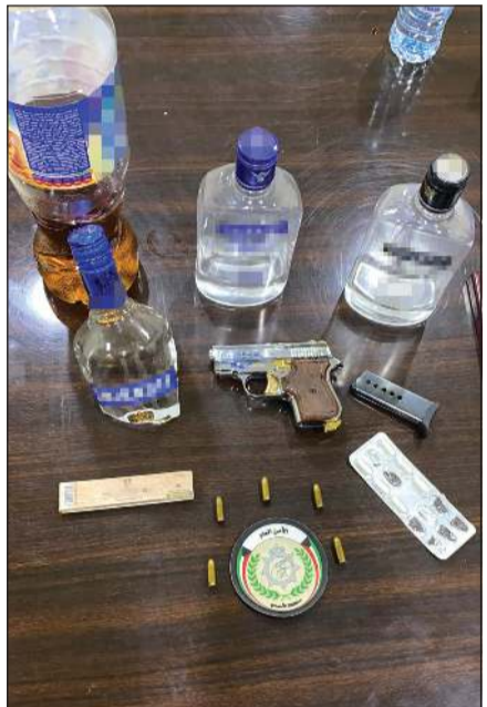
المسدس والخمور المستوردة