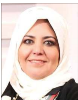
د. وجدان العقاب

ترغب في تعزيز دعماً للأمن المتحدة وللتعاون المتعدد الأطراف، وتظل على قناعة بأن العمل الجماعي ضروري للتصدي بنجاح للتحديات العالمية، ويساورها بالغ القلق إزاء الآثار العالمية المدمرة لوباء «كوفيد - 19» التي يترتب عليها تحديات صحية واجتماعية واقتصادية وبيئية جديدة وخطيرة، والتي تضاعف التحديات القائمة، ولأسسما في البلدان النامية، مما يقوض جهودنا المشتركة للقضاء على الفقر وإنجاز خطة التنمية المستدامة لعام 2030. وأضافت أن «الجمعية الأممية تدرک أكثر من أي وقت مضى أن صحة الإنسان