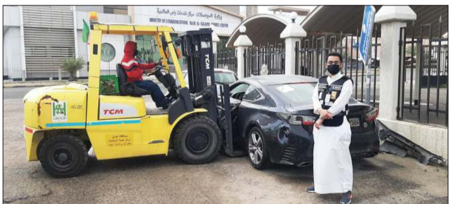
رفع إحدى السيارات المهيمة

بمراقبة إشغالات الطرق بتنفيذ جولات ميدانية أسفرت عن رفع 75 سيارة مهيمة إلى جانب تحرير 20 مخالفة إشغالات طرق لعدم الالتزام بالشروط والضوابط.