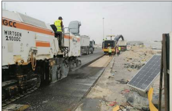
الهيئة تكثف جهودها لتحقيق أكبر قدر من الإنجاز مع الاستفادة من فترة الحظر