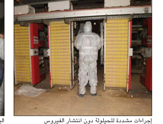
إجراءات مشددة للحيلولة دون انتشار الفيروس