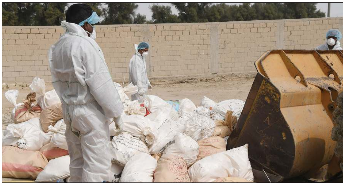
جانب من عملية التخلص من الدجاج بعد إعدامه (محمد هاشم)