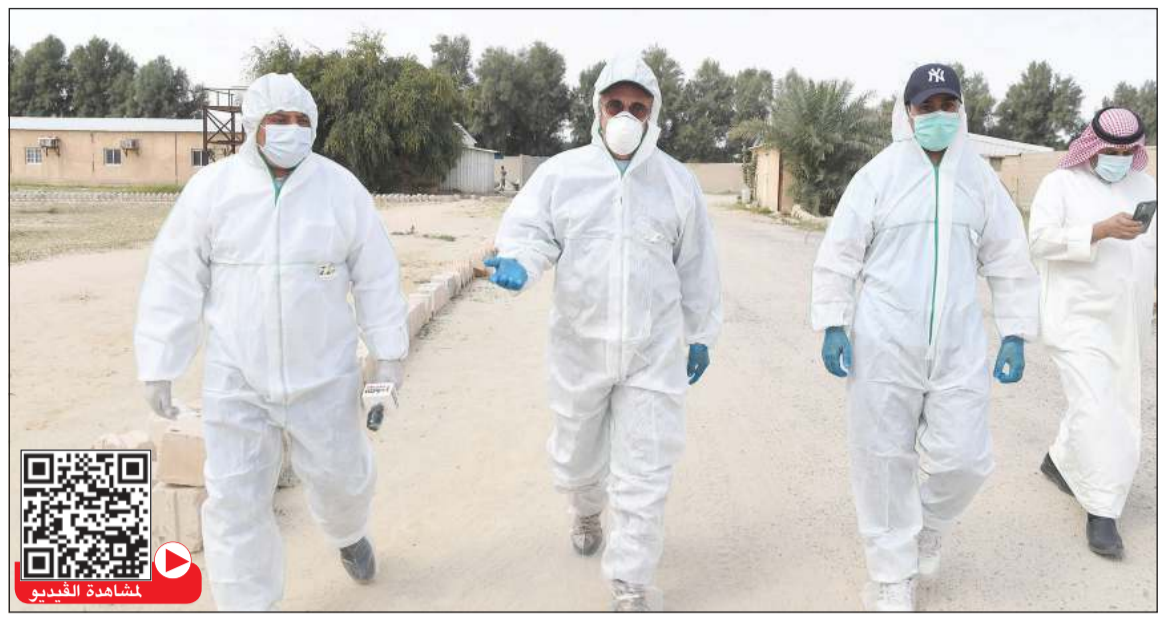
الشيخ محمد اليوسف خلال جولته التفقدية للاطلاع على عملية التخلص من الدجاج في المزرعة التي ظهرت بها حالات أنفلونزا الطيور بالوفرة (مشاهدة الفيديو)