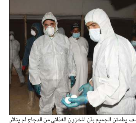
اليوسف يطمئن الجميع بأن المخزون الغذائي من الدجاج لم يتأثر

تأكيدا على سلامة الدجاج على الإنسان، مازح الشيخ محمد اليوسف الإعلاميين قائلا: «أنا اليوم سأخذ من الدجاج المصاب وأطبخه وأكله». وقال: إن هذا الدجاج بياض وكذلك الدجاج الموجود في مزرعة العبدي توجد أمهات للتفريخ، هذا بالنسبة للدجاج الحي، أما الدجاج المتلج فمتوافر في الجمعيات التعاونية وفروع التموين والأسواق وكذلك الدجاج الحي متوافر.