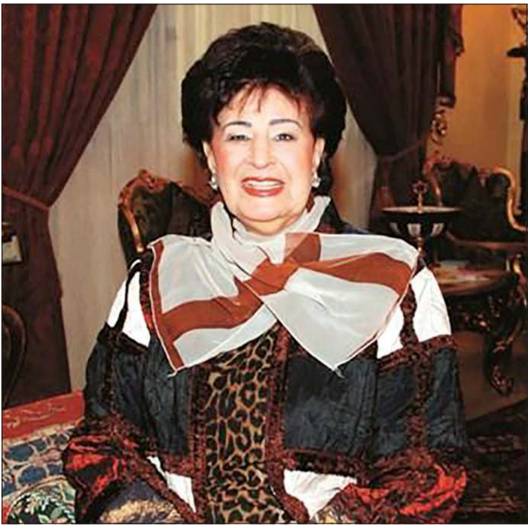
دخلت المستشفى الأميري أول من أمس