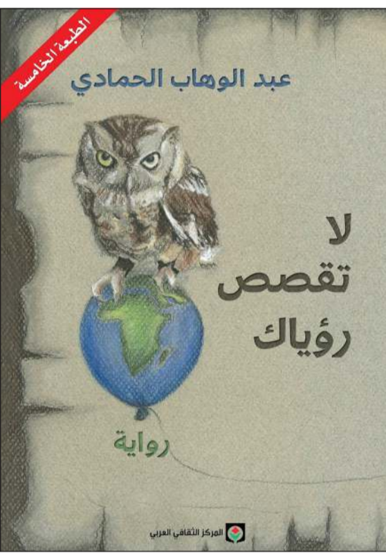
«لا تقصص رؤياك».. أحد أعمال عبدالوهاب الحمادي

وهل الكتب الإلكترونية باتت المنافس الأشد للكتب والإصدارات الورقية؟ ● حقيقة، إن العالم يتطور بشكل متسارع، وهذا التطور أيضاً طال الحركة الثقافية عموماً، وبالنسبة للمكتب الإلكتروني أرى أنها مناسبة جداً لعشاق القراءة حيث أصبحت لدينا ملايين العناوين التي نستطيع الوصول إليها بكل سهولة، إضافة على ما نشهده أيضاً من انتشار للكتب الصوتية، والتي تسهل علينا أيضاً الاطلاع عليها بشكل سماعي وهي تجربة تستحق أن نعيشها ونستفيد منها خاصة مع ما نشهده من زحام في الطرقات.