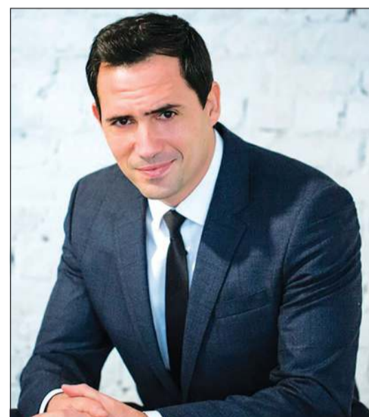
القاهرة - محمد صلاح

بسامحني إن خانتني الذاكرة لأن أفكارى وأشياي مبعثرة، وفي النهاية تعود علاقتنا من جديد أقوى. وحول تصوير كليب الأغنية الذي كان بسيطاً إلا أنه كان معبراً عن حالة الأغنية، ردت: التصوير تم عن طريق شاب موهوب واسمه بارز هذه الأيام بشكل كبير هو «فيجول راشد» الذي تصدى لإخراج الكليب بعد أن عقدنا اجتماعاً معه وقررنا أن يكون تصوير الأغنية خارجياً في مكان مفتوح بسبب