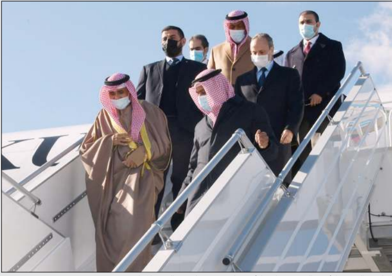
صاحب السمو الأمير الشيخ نواف الأحمد لدى وصوله مع الوفد المرافق