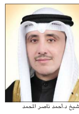
الشيخ د.أحمد ناصر الحمد

رئيس مركز الدراسات السياسية والاستراتيجية بالشرق الأوسط في المملكة العربية السعودية. عزت – الرئيس الأعلى لمؤسسة المرأة العربية في المملكة العربية السعودية. السفير بندر بن محمد العطية – سفير دولة قطر لدى الكويت