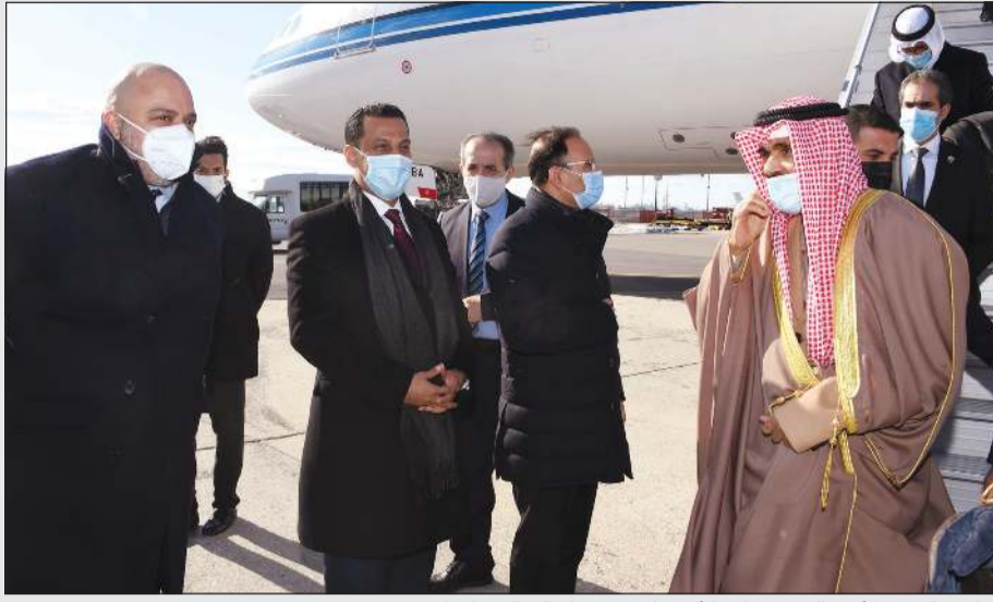
صاحب السمو الأمير الشيخ نواف الأحمد لدى وصوله إلى الولايات المتحدة

بحفظ الله ورعايته وصل صاحب السمو الأمير الشيخ نواف الأحمد إلى الولايات المتحدة الأمريكية الصديقة. هذا وكان في استقبال سموه على أرض المطار سفيرا لدى الولايات المتحدة الأمريكية الشيخ سالم العبدالله ومندوبا الدائم لدى الأمم المتحدة السفير منصور العتيبي وقنصل عام الكويت لدى مدينة نيويورك حمد علي الهزيم وأعضاء السفارة. إلى ذلك بعث صاحب السمو الأمير الشيخ نواف الأحمد ببرقية تهنئة إلى الرئيس نانا أكوفو أدي رئيس جمهورية غانا الصديقة عبر فيها سموه عن خالص تهانئه بمناسبة ذكرى العيد الوطني لبلاده، متمنيا سموه رعاها الله لفخامته موفور الصحة والعافية وللبلد الصديق دوام التقدم والازدهار. وبعث سمو نائب الأمير وولي العهد الشيخ مشعل الأحمد ببرقية تهنئة إلى الرئيس نانا أكوفو أدي رئيس جمهورية غانا الصديقة ضمنها سموه خالص تهانئه بمناسبة ذكرى العيد الوطني لبلاده راجيا سموه له دوام الصحة والعافية. كما بعث سمو الشيخ صباح الخالد رئيس مجلس الوزراء ببرقية تهنئة مماثلة.