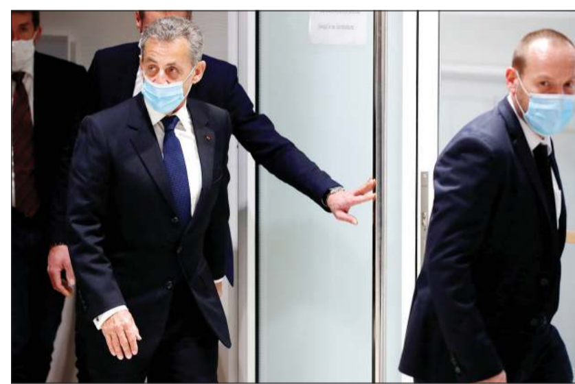
الرئيس الفرنسي الأسبق نيكولا ساركوزي مغادرا المحكمة عقب إصدار الحكم عليه بمحكمة جنات باريس

باريس - وكالات: وجهت محكمة فرنسية صفقة للرئيس الأسبق نيكولا ساركوزي، الذي أصبح أول رئيس سابق يصدر بحقه حكم مع النفاد، فيما يسمى بقضية «التنصت» التي تعود لعام 2014.