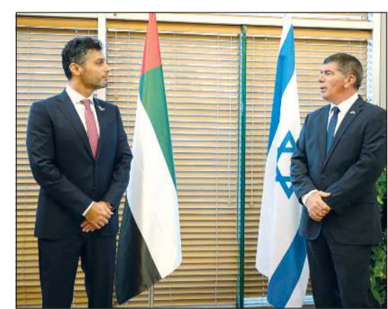
صورة نشرها السفير محمد الخاجة مع الوزير غابي أشكينازي «على تويتر»

عواصم - وكالات: وصل محمد محمود الخاجة أول سفير لدولة الإمارات العربية المتحدة إلى إسرائيل أمس، وقدم السفير أوراق اعتماده إلى الرئيس الإسرائيلي ريفلين، واجتمع السفير الإماراتي مع وزير الخارجية الإسرائيلي. وتكب الخاجة عبر حسابه في «تويتر»: «وصلت اليوم (أمس) إلى تل أبيب كأول سفير لدولة الإمارات لدى دولة إسرائيل والتقيت بمعالي غابي أشكينازي وزير الخارجية الإسرائيلي، حيث ناقشنا العلاقات الثنائية بين بلدينا والنمو الكبير الذي شهدته منذ توقيع الاتفاق الإبراهيمي للسلام بالإضافة إلى سبل تعزيز التعاون في المجالات المختلفة..»