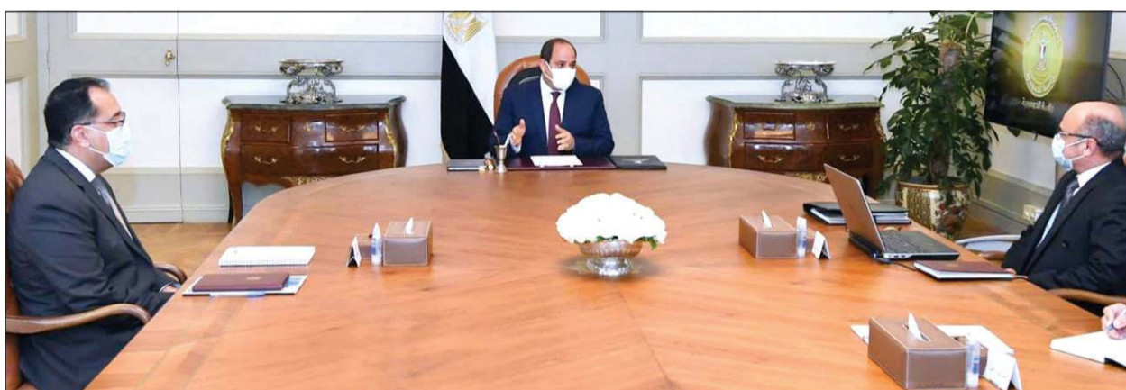
جانب من اجتماع الرئيس عبد الفتاح السيسي مع د.مصطفى مديبولي رئيس مجلس الوزراء والمستشار عمر مروان وزير العدل