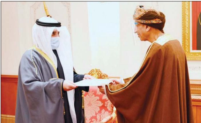
الشيخ د. أحمد ناصر المحمد يسلم رسالة صاحب السمو إلى نائب رئيس الوزراء لشؤون مجلس الوزراء بسلمة عمان صاحب السمو السيد فهد بن محمود آل سعيد

■ ليحفظ الله الوطن العزيز ويُدِّم عليه نعمة الأمن والأمان والازدهار ويوفق الجميع لخدمته ورفعته وإعلاء شأنه ■ ولي العهد للمواطنين والمقيمين: مشاعرهم الفياضة جسدت روح أسرة أهل الكويت الواحدة ونستذكر بكل فخر شهداءنا