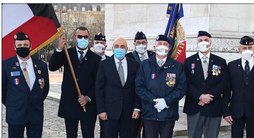
سفيرنا لدى فرنسا سامي السليمان يشارك في احتفالية وزارة الدفاع

وأكدت أن قوات التحالف حققت نجاحاً ساحقاً في حرب تحرير الكويت، مشيرة إلى دور فرنسا في عملية إزالة الألغام بعد الحرب.