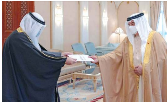
الملك حمد بن عيسى آل خليفة لدى تسلمه رسالة صاحب السمو الأمير الشيخ نواف الأحمد من وزير الخارجية الشيخ د. أحمد ناصر المحمد

وزير الخارجية بحث مع نظيره العماني والبحريني دعم مجالات التعاون المشترك