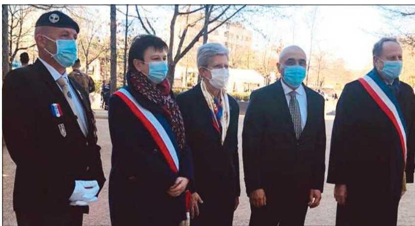
السفير سامي السليمان والوزير المنتدب جينيف دار يوسيك خلال احتفالية الوزارة

■ جينيف دار يوسيك: قوات التحالف حققت نجاحاً ساحقاً في حرب التحرير وفرنسا كان لها دور في إزالة الألغام