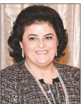
الشيخة هالة بدر المحمد

«شهر فبراير أجمل الشهور وأحبها إلى الكويتيين، خاصة يومي 25 و 26 منه، فالدولة تزخر بحروس في ليلة زفافها، فتختطف أنصار الجميع الذين يتطلعون إليها مشاركين فرحتها وهي ترمز بأجمل أيام العام».