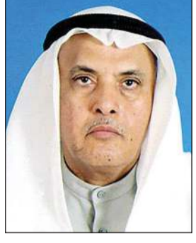
شعر: د. يعقوب يوسف الغنيم