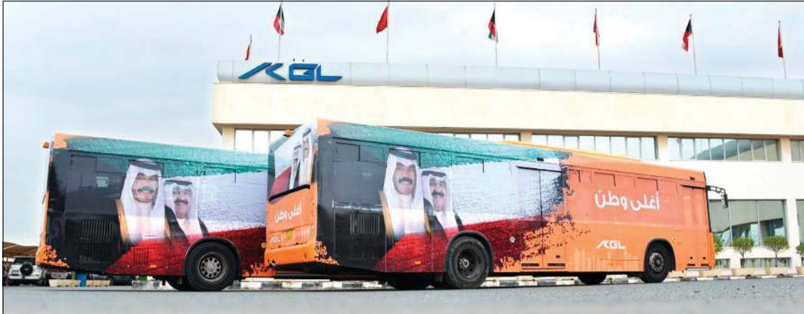
حافلات «كي جي إل» وقد تزينت بصور صاحب السمو الأمير الشيخ نواف الأحمد وولي العهد الشيخ مشعل الأحمد

اكتست حافلات ومعدات ومبنى مجموعة شركات رابطة الكويت والخليج للنقل «كي جي إل» بالإعلام الوطنية وصور صاحب السمو الأمير الشيخ نواف الأحمد وسمو ولي عهده الأمين الشيخ مشعل الأحمد بمناسبة الأعياد الوطنية. وبهذه المناسبة، قال رئيس مجلس إدارة المجموعة ماهر معرفي: إن تزيين الحافلات وجمع مرافق المجموعة يأتي تعبيراً عن الفرح والروح الوطنية في قلوب الشعب الكويتي. وأوضح معرفي أن المجموعة كانت تخطط لإحتفالية أكبر من ذلك، إلا أن الأوضاع الراهنة في ظل احترازات الدولة مكافئة جائحة «كورونا» أدت إلى أن يكون مسار المجموعة في هذا الإحتفال الوطني محدوداً، وتحويل كل الجهود لدعم مسار سمو رئيس مجلس