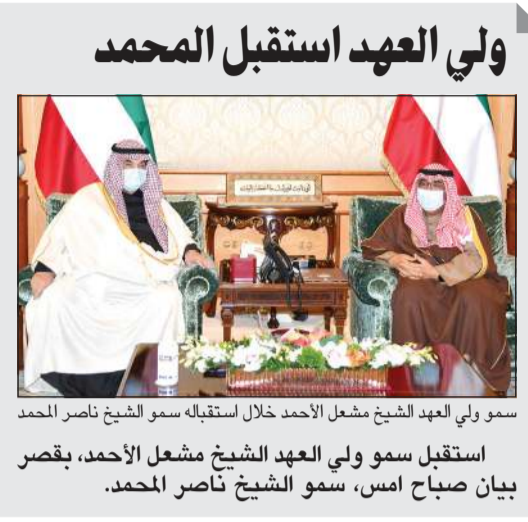
صاحب السمو الأمير الشيخ نواف الأحمد مستقبلاً سمو الشيخ ناصر المحمد