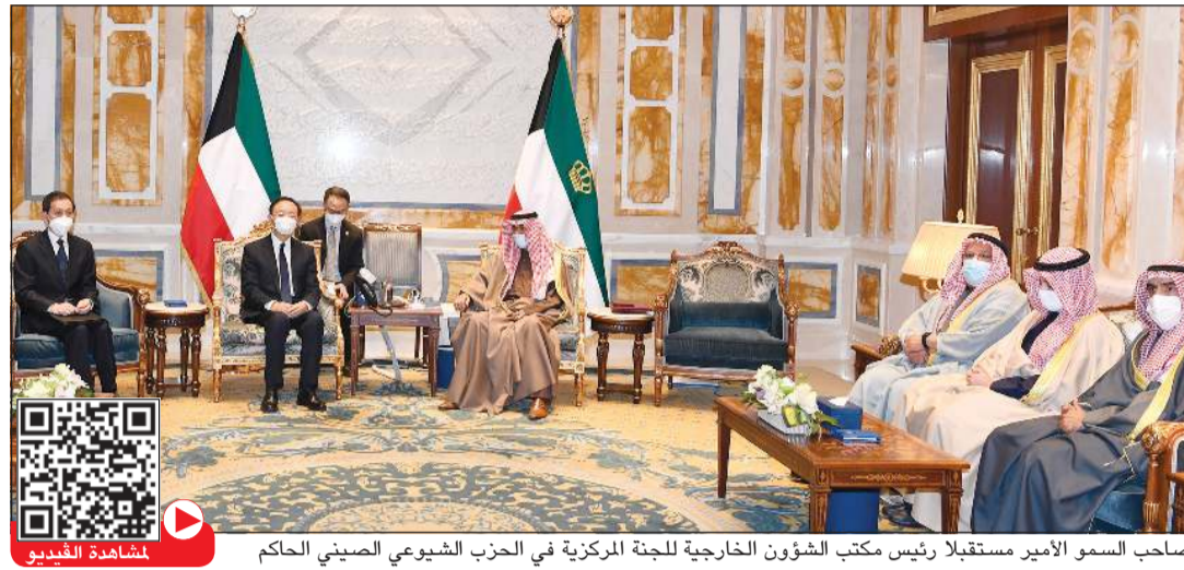
صاحب السمو الأمير مستقبلاً رئيس مكتب الشؤون الخارجية للجنة المركزية في الحزب الشيوعي الصيني الحاكم