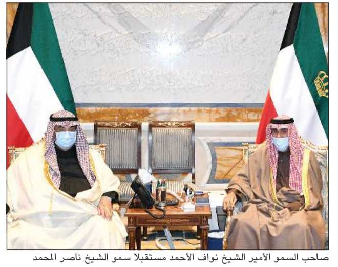
صاحب السمو الأمير الشيخ نواف الأحمد مستقبلاً سمو الشيخ ناصر المحمد

ولي العهد استقبال محمد وهنأ رئيس غيانا وسلطان بروناي بالعيد الوطني وإمبراطور اليابان بذكرى ميلاده.. وتلقى اتصالاً هاتفياً من رئيس قرغيزيا للتهنئة بالأعياد الوطنية استقبل سمو ولي العهد الشيخ مشعل الأحمد، بقصر بيان صباح امس، سمو الشيخ ناصر المحمد.