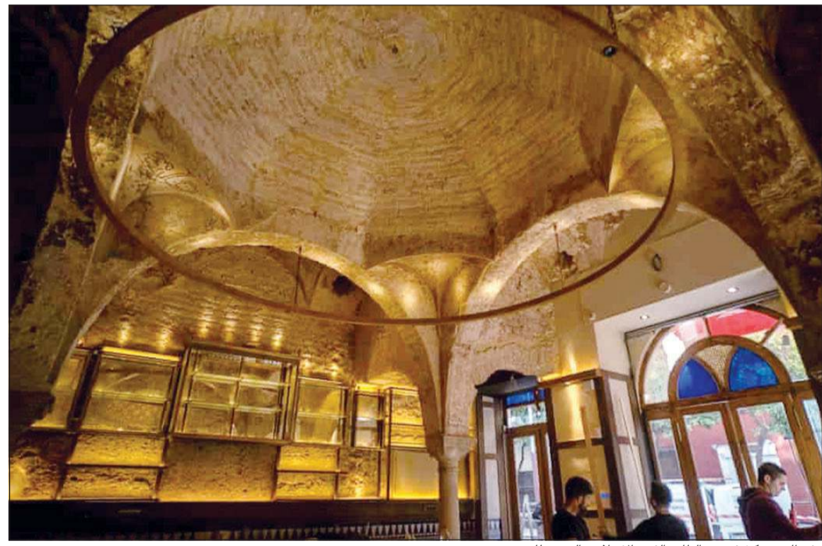
رفع الجص كشف عن الطابع الفني الإسلامي العريق للمبنى

كان المبنى كما يقول عالم الآثار يعود بتاريخه إلى فترة خلافة الموحدين في شبه الجزيرة الأيبيرية. وفضلاً عن فتحات الضوء كشفت أعمال التجديد عن نقوش ورسومات فريدة كانت تزين المبنى ولكنها كانت مغطاة بطبقات من الجص التي اضيفت عبر السنين. الاحتفاء بهذا الاكتشاف المذهل لم ينس فضل المهندس المعماري الذي احترق تاريخ المبنى وحافظ على نقوشه ورسوماته بأن غطاهما بالجص. وهذا ما قرر أصحاب المبنى المحافظة عليه وبذلك سيستمتع رواد المكان الذي سيفتح قريباً ليس فقط بتاريخه بل أيضاً ببهاء طابعه الفني الإسلامي العريق.