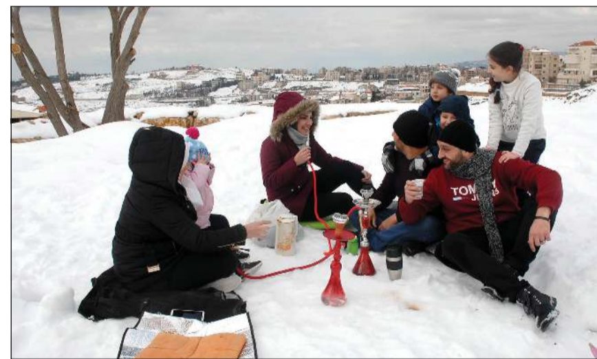
عائلة لبنانية خلال استراحة غداء على الثلوج في بدمون بعد انحسار العاصفة الثلجية

وعشية بدء المرحلة الثانية من تخفيف إجراءات الإقفال العام غداً، سجل عداد الكورونا 2255 إصابة جديدة و51 حالة وفاة، وفي المرحلة الجديدة التي تنتهي في الثامن من مارس، حيث تبدأ المرحلة الثالثة من تخفيف الإجراءات، ستفتح معارض السيارات ومرائب تصليح السيارات والحافلات وأعمال البناء والمصانع بسعة 40٪. ووصلت إلى بيروت أمس 31500 جرعة فايزر.