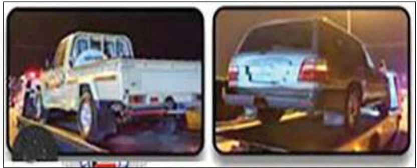
مركبات مخالفة ضبطت خلال حملة منطقة كبد

الدرون أثناء ارتكابهم مخالفة الرعونة بالقيادة.