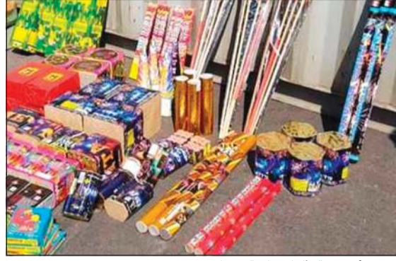
صورة أرشيفية لألعاب نارية محظورة