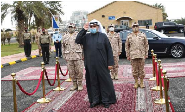
استقبال الشيخ حمد جابر العلي في هيئة التعليم العسكري