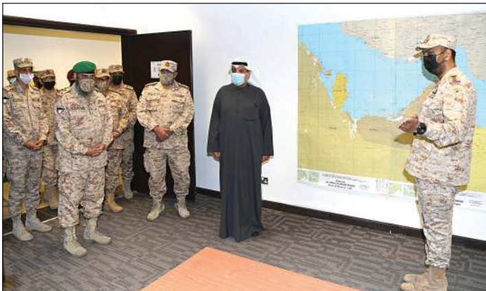
جولة وزير الدفاع في كلية القيادة والأركان

وفي ختام جولته، دعا نائب رئيس مجلس الوزراء وزير الدفاع الشيخ حمد جابر العلي منتسبي الوحدات التي قام بزيارتها إلى السعي دائما إلى تحقيق التطور والارتقاء والتميز في أدائهم، للوصول به إلى المستويات المنشودة، وحتى يكونوا دائما على أتم الاستعداد لتنفيذ مختلف المهام والواجبات التي توكل إليهم، متمنيا لهم دوام التوفيق والسداد، والعمل لما فيه خير هذا الوطن المعطاء، في ظل القيادة الحكيمة لصاحب السمو الأمير وسمو ولي عهده الأمين، حفظهما الله ورعاهما، وسدد على طريق الخير خطاهما.