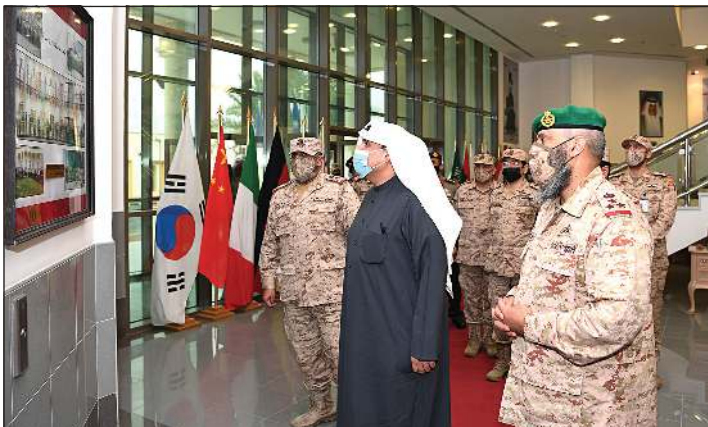
جانب من جولة الوزير في كلية القيادة والأركان

به، وما تملكه من إمكانيات فنية متطورة، وقدرات بشرية مؤهلة، جعلت منها إحدى أفضل الوجهات الأكاديمية العسكرية التي يقصدها الضباط للدراسة والتأهيل في مجال القيادة، وهو أمر يبعث في النفس الفخر والاعتزاز بهذا الصرح التعليمي الذي أصبح سفيرا لسمعة المؤسسة العسكرية الكويتية ومننسبها. بعد ذلك، انتقل نائب رئيس مجلس الوزراء وزير الدفاع الشيخ حمد جابر العلي في جولته التفقدية إلى زيارة هيئة التعليم العسكري، حيث كان في استقباله رئيس الهيئة «موطنا للقيادة والقادة ومحلا للتأهيل والريادة»، ووجهة للضباط الذين يتطلعون إلى تطوير قدراتهم العلمية، ومهاراتهم العملية، وتعزيز مستوى ثقافتهم وخبرتهم العسكرية، والذي يؤهلهم لتولي زمام القيادة مستقبلا وتحمل مسؤولياتها.