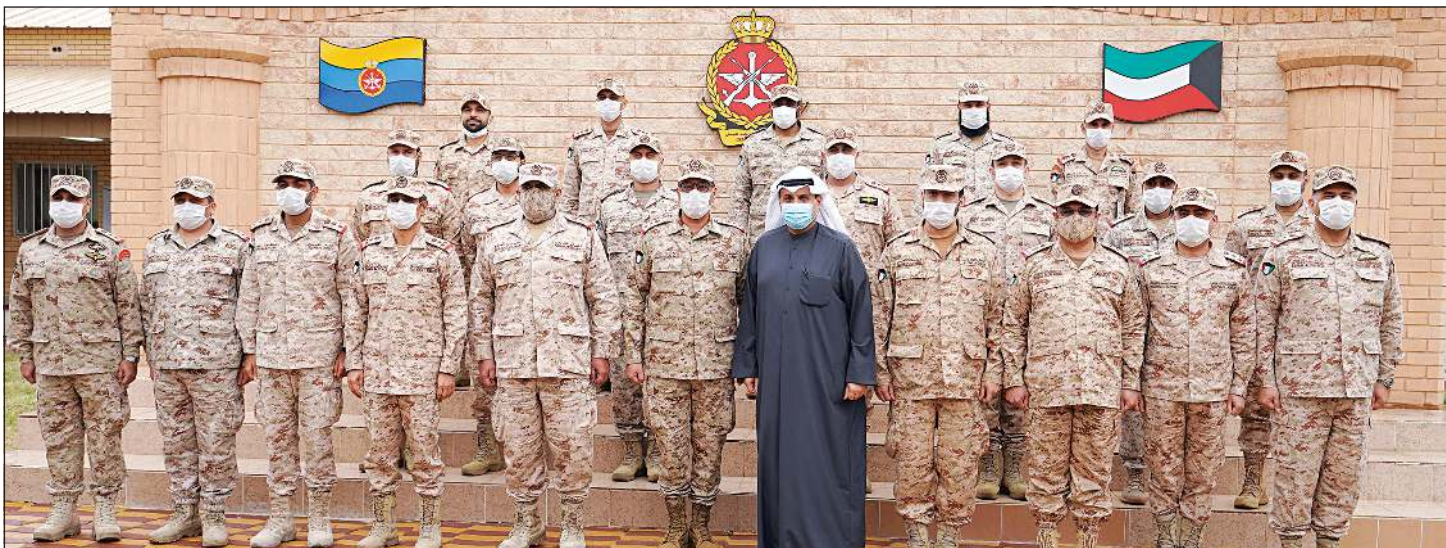
الشيخ حمد جابر العلي والفريق الركن خالد صالح الصباح والفريق الركن فهد الناصر وعدد من كبار قادة الجيش مع منتسبي هيئة التعليم العسكري

قام نائب رئيس مجلس الوزراء وزير الدفاع الشيخ حمد جابر العلي بجولة تفقدية شملت عددا من الوحدات العسكرية، رافقه فيها رئيس الأركان العامة للجيش الفريق الركن الشيخ خالد صالح الصباح، ونائب رئيس الأركان العامة للجيش الفريق الركن فهد الناصر، وعدد من كبار قادة الجيش.