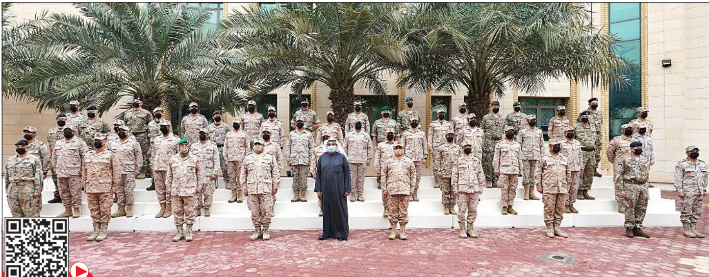
الشيخ حمد جابر العلي والفريق الركن خالد صالح الصباح والفريق الركن فهد الناصر وعدد من كبار قادة الجيش في صورة جماعية في كلية القيادة والأركان