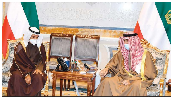
صاحب السمو الأمير الشيخ نواف الأحمد خلال استقباله محمد الشارح

أعربت وزارة الخارجية عن إدانة واستنكار الكويت للهجمات الصاروخية التي تعرضت لها مدينة أربيل في الجمهورية العراقية الشقيقة مساء أمس وأدت إلى مقتل وجرح عدد من الأشخاص. وشددت الوزارة في بيان لها على قناعتها بأن مثل هذه الأعمال الإجرامية لن تفني الأثام في العراق عن مواصلة جهودهم