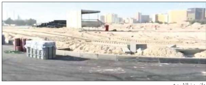
جانب من المشروع