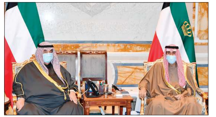
صاحب السمو الأمير الشيخ نواف الأحمد مستقبلاً سمو الشيخ ناصر المحمد