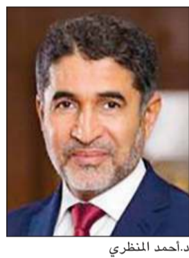
د. أحمد المنظري

الحالات عبر التتبع العكسي والذي يعد أمرا حاسم الأهمية لاكتشاف سلاسل السراية غير المعروفة، ونقاط التعرض المشترك. ونوه إلى أن منظمة الصحة العالمية حدثت الإرشادات المبدئية عن «تتبع المخالطين في سياق جائحة كوفيد-19» ورشادات بشأن تحديد أولويات أنشطة تتبع المخالطين استنادا إلى المخاطر، عندما تكون