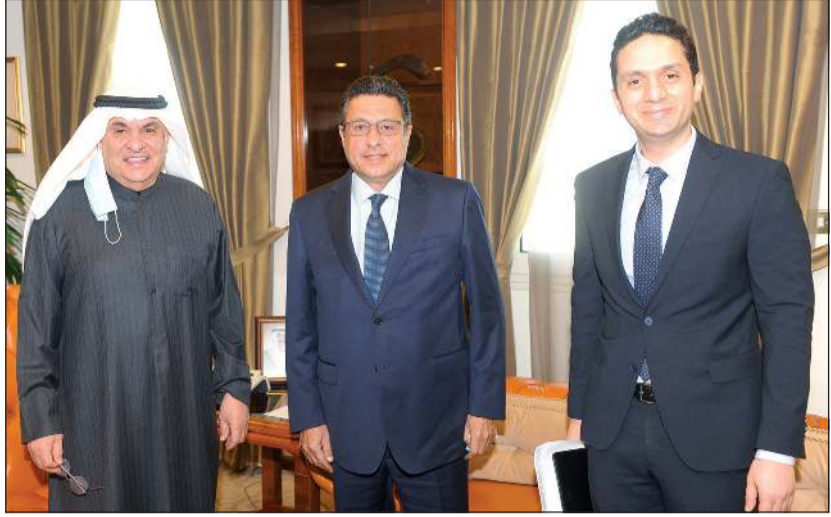
محمد الصقر خلال استقباله السفير طارق القوني وأحمد أبوالمجد

■ القوني: حريصون على تعميق العلاقات الاقتصادية والتجارية بين البلدين لتحقيق المصالح المتبادلة