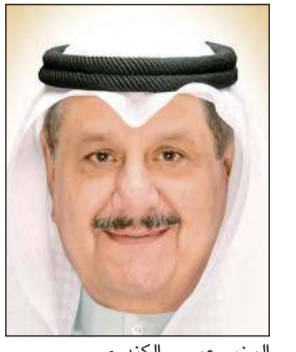
الوزير عيسى الكندي