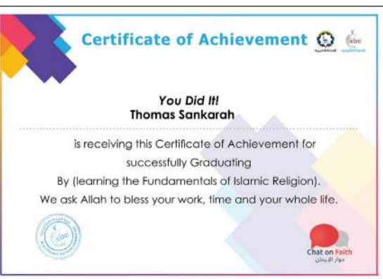
شهادة اجتياز الدورة