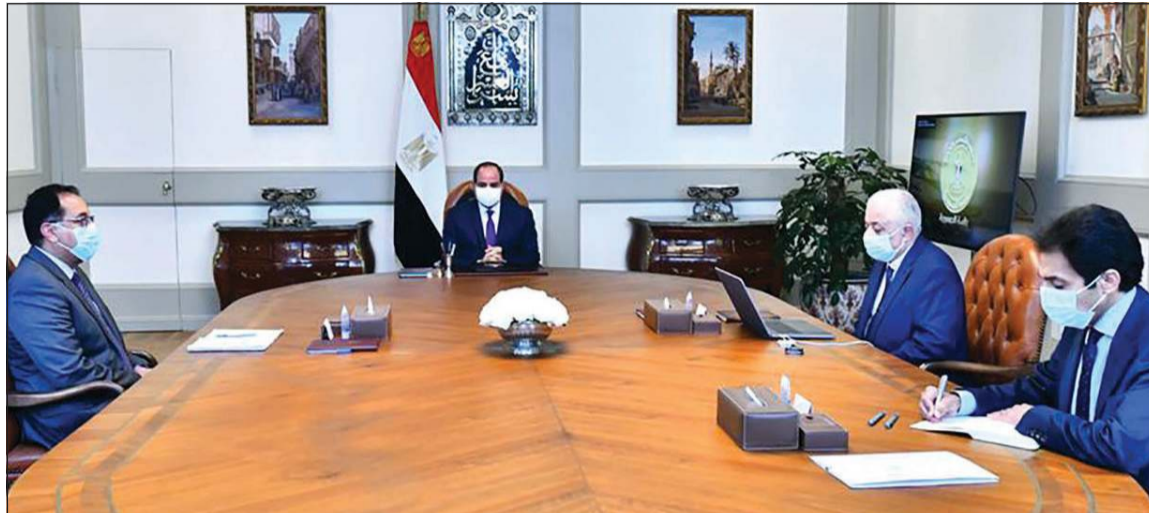
جانب من اجتماع الرئيس عبدالفتاح السيسي مع رئيس مجلس الوزراء د. مصطفى مدبولي ووزير التربية والتعليم د. طارق شوقي