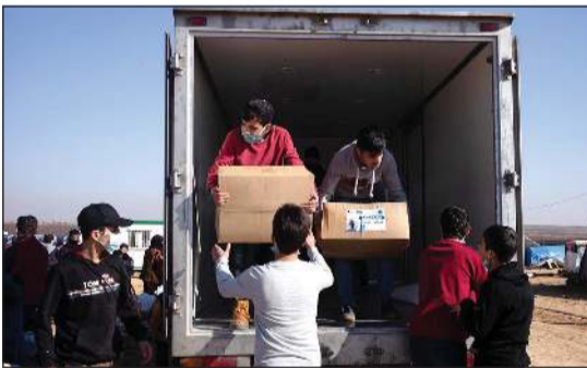
جانب من توزيع المساعدات

تواصل «نماء الخيرية» بجمعية الإصلاح الاجتماعي توزيع مساعداتها على اللاجئين السوريين، حيث قامت بتوزيعها في محافظة إربد بحضور سفيرنا لدى المملكة الأردنية الهاشمية عزيز الديحاني ووفد نداء الخيرية. وقال سفيرنا لدى المملكة الأردنية الهاشمية عزيز الديحاني: «شاركنا وفد نداء الخيرية توزيع المساعدات على الأسر المتضررة في محافظة إربد، مشيراً إلى أن العمل الخيري الكويتي لم ينقطع بالرغم من جائحة كورونا بتوجيهات من صاحب السمو الأمير الشيخ نواف الأحمد، مؤكداً أن المستفيدين حرصوا على الدعاء لأميرنا الراحل الشيخ صباح الأحمد. وقال الديحاني: ستظل الكويت دوماً على نهج العمل الإنساني الذي ثبتت قواعده الأثير الراحل وستبقى الجهود الإغاثية والخيرية من السمات الثابتة للكويت وقيادتها وأهلها، مبيناً أن ما تقوم به الجمعيات الخيرية والإنسانية الكويتية من جهود إغاثية واجب وحق تجاه المستفيدين من المحتاجين والأسر المتعفة، مؤكداً الحرص على أن تبقى الكويت في مقدمة الدول الداعمة للأوضاع الإنسانية لشعوب العالم أجمع دون تمييز.