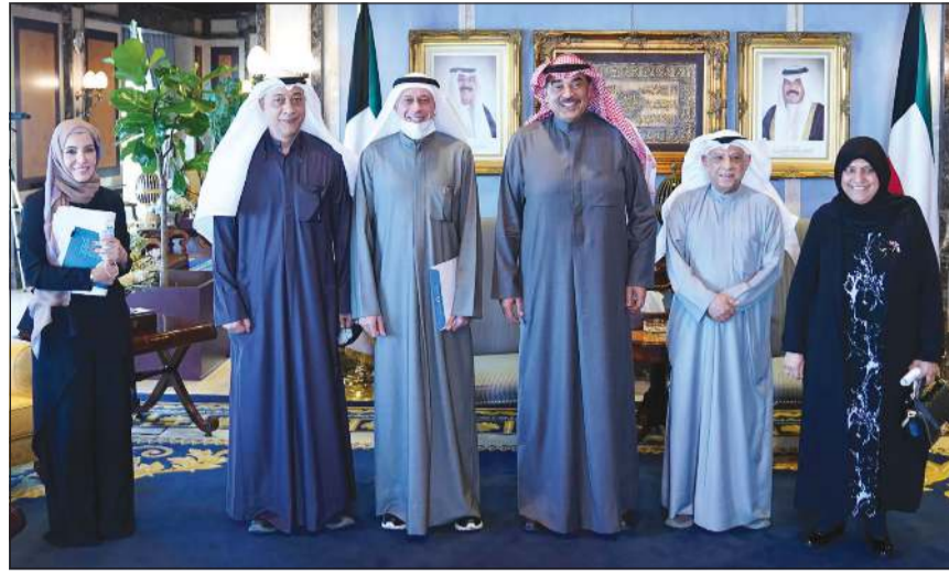
سمو الشيخ صباح الخالد خلال استقباله أعضاء الجمعية الكويتية لجودة التعليم

■ ضرورة فصل «التطبيقي والتدريب» لوجود سلبات عدة وإعادة هيكلة المجلس الأعلى للتعليم وإحاقه برئاسة مجلس الوزراء