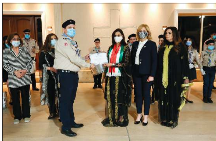
تكريم مجموعة كشافة مار يوحنا العمدان