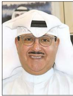
الشيخ فهد المبارك

تقدم مدير عام جمعية النجاة الخيرية بالتكليف د. جابر الوئدة بأسمى آيات التهاني لوزير الإعلام وزير الدولة لشؤون الشباب عبدالرحمن المطيري وللوكيل المساعد لشؤون الإذاعة الشيخ فهد المبارك ولكل الإذاعات الكويتية والعاملين بها وذلك بمناسبة اليوم العالمي للإذاعة الذي يوافق 13 من شهر فبراير الجاري، مبيناً أن هذا اليوم يمثل فرصة عظيمة نستذكر