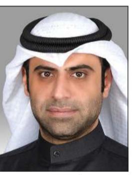
د.محمد روح الدين

وجه النائب د.محمد روح الدين سؤالين أولهما إلى وزير الداخلية الشيخ ثامر العلي استفسر فيه عن الآتي: 1- ما عدد القادمين للكويت من خلال جميع منافذ الدولة خلال الفترة من تاريخ 2021/2/7 إلى تاريخ الإجابة عن هذا السؤال، وما عدد الكويتيين منهم، وما عدد غير الكويتيين منهم، وهل كان من غير الكويتيين من غير الحالات المشتبهة بموجب التعميم رقم 2021/2/6؟ 2- ما عدد ركاب كل رحلة على حدة؟ 3- ما الوجهات القادمة منها هذه الرحلات المؤرخ في 2021/2/3؟