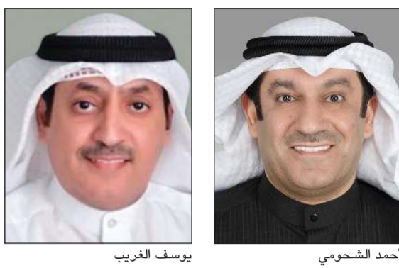
يوسف الغريب أحمد الشحومي

قدم نائب رئيس مجلس الأمة النائب أحمد الشحومي والنائب يوسف الغريب اقتراحاً برغبة، قالا في مقدمته: يعاني أهالي منطقة سلوى السكنية من كثافة سكانية عالية مما يجعلهم يواجهون مشكلة في تلقي العلاج بمستوصفات المنطقة، وذلك بسبب إغلاق المستوصف الخاص بالمنطقة وتحديدًا في القطعة (11) في ساعة متقدمة وتحويلهم إلى المستوصف الآخر داخل المنطقة للعلاج. لذا فإننا نتقدم بالاقترح التالي: