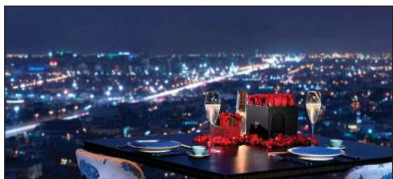
أكثر أماناً في سفير

قامت شركة سفير للفنادق والمنتجعات والمتمثلة في الكويت (فندق مارينا الكويت، فندق سفير الفنتاس، فندق سفير المطار) بالامتثال والالتزام بقرارات مجلس الوزراء الصادرة بتاريخ 3 فبراير 2021، وذلك بإغلاق صالات الألعاب الرياضية وخدمات المنتجعات الصحية والصالونات والسبا وأيضاً التدريبات الخاصة، وكذلك إغلاق المطاعم في تمام الساعة الثامنة مساءً. كما قامت بتعميد عضوية أعضاء النادي الصحي لمدة شهر، وذلك مراعاة لأعضاء النادي الكرام، في حين تظل حمامات السباحة الثلاثة لفندق مارينا وشاطئ البحر متاحة للضيوف والأعضاء مع إيقاف خدمات الأغذية والمشروبات في تلك المرافق حتى إشعار آخر. بينما تظل الكششة على الشاطئ تستقبل ضيوفها.