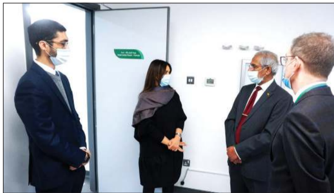
سفير سريلانكا يستمع لشرح عن خدمات المركز