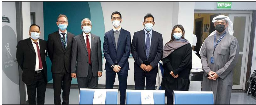
لقطة تذكارية خلال زيارة سفير سريلانكا لمركز «ضمان» في حولي

وقام سفير جمهورية سريلانكا الديموقراطية الاشتراكية عثمان محمد جوهر بزيارة إلى شركة مستشفيات الضمان الصحي «ضمان» رافقه خلالها الوزير المفوض بالسفارة بوشيشا بيريرا. وخلال جولة في أحد مراكز الرعاية الصحية الأولية، تلقى السفير عرضاً توضيحياً حول دور «ضمان» في قطاع الرعاية الصحية باعتبارها من أهم المشاريع الرئيسية في خطة التنمية «كويت جديدة 2035» والتي تقدم خدماتها من خلال منظومة صحية متكاملة تتكون من شبكة مركز رعاية صحية أولية ومستشفيات وتستقبل يقارب 2 مليون من المقيمين العاملين في القطاع الخاص وعائلاتهم. وفي هذا الصدد، أعرب السفير عن تقديره وامتنانه للكويت لما تقوم به من جهود لتوفير خدمات رعاية صحية متكاملة من خلال «ضمان» وهو ما يساهم بشكل كبير في صحة وسلامة جميع الأفراد المقيمين في الدولة من خلال تطبيق الخطوات اللازمة للتوعية والوقاية والعلاج.