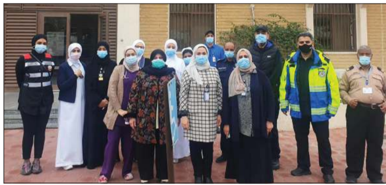
أحد فرق التطعيم أمام مركز السلام الصحي