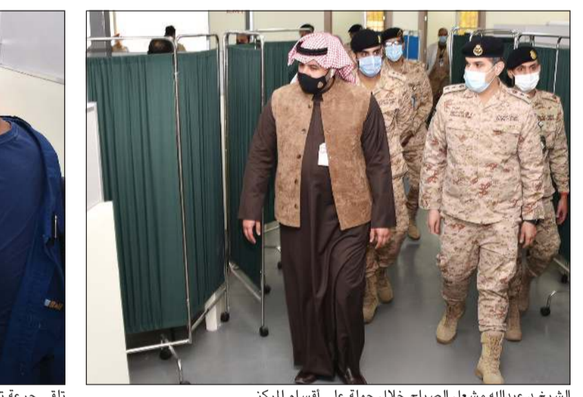
الشيخ د.عبدالله مشعل الصباح خلال جولة على أقسام المركز

هي دعم واسناد لجهود وزارة الصحة لتطعيم منتسبي وزارة الدفاع الوطني وقوة الإطفاء العام، كما أكد العقيد د.رائد التجلي أنه تم إنشاء مركز التطعيم الطبي وفق الاشتراطات الطبية التي وضعت من قبل وزارة الصحة.