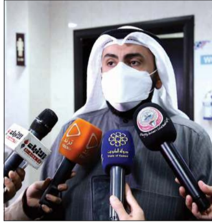
الشيخ دباس الصباح متحدثاً للصحافيين