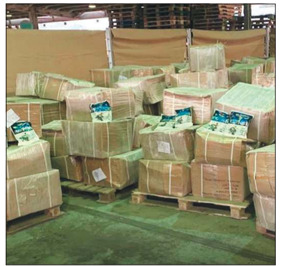
المضبوطات من المواد المحظورة

مبارك التنيب أحبط رجال جمارك ميناء الشويخ محاولة تهريب 840 ألف كيس تمباك مخبأة بحاوية مساحتها 40 قدماً، قادمة من إحدى الدول الآسيوية. وكان مفتش بالميناء اشتبه في حاوية تحتوي على بضاعة عبارة عن أدوات صحية، تم تفتيشها بدقة، وعثر فيها على 800 كرتون بداخلها 840 ألف كيس صغير من مادة التمباك. ويشار إلى أن مادة التمباك من المواد المخالفة للقوانين الجمركية، وتمنع قوانين التجارة ووزارة الصحة دخول هذه النوعية من البضائع، هذا، وتم اتخاذ الإجراءات اللازمة وإعداد محضر ضبط بالبضاعة تمهيدا لمصادرتها.