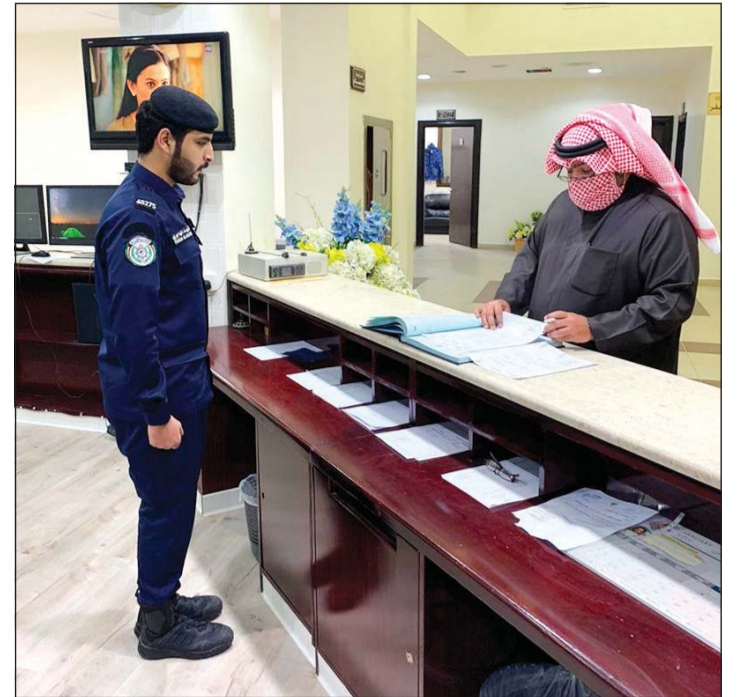
الشيخ ثامر العلي يديق في دفتر الأحوال