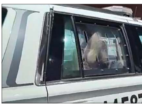
من واقعة إتلاف الفئاة للدورية الأسبوع الماضي

أن يحال إلى الطب الشرعي لتوثيق نوعية المادة التي جعلته في هذه الحالة تمهيدا لإحالاته إلى جهة الاختصاص، من جهة أخرى، اقتيدت امرأة إلى نظارة أحد مخافر محافظة العاصمة تمهيدا لإحالتها إلى الأدلة الجنائية للوقوف على أسباب حالتها غير الطبيعية وما إذا كانت ناتجة عن سكر أو حالة مرضية. وبحسب مصدر أمني، فإن عمليات وزارة الداخلية تلقت بلاغا يفيد بوجود امرأة في حالة غير طبيعية وعلى الفور تم توجيه دورية أمن وجري توقيف السيدة.