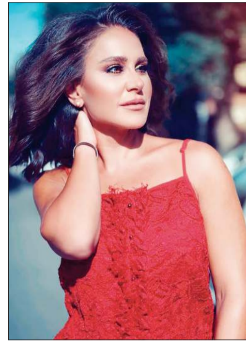
دمشق - هدي العبيد

تحدثت الفنانة ديمة قندلفت عن التنمر الذي تعرضت له خلال عملها في المجال الفني، والطريقة التي نجحت من خلالها في تجاوز الأمر، وتطرقت للمرة الأولى إلى إصابتها بطلق ناري ضمن تصوير مسلسل «الاجتياح»، مع المخرج التونسي الراحل شوقي الماجري. وروت ديمة، أثناء استضافتها في برنامج «الدنيا علمتني»، تفاصيل الحادثة، وقالت أنه في آخر أيام تصوير دورها في «الاجتياح»، تعرضت لإصابة وتآكل جزء من ذقنها، ما جعلها تشعر لوهلة أنها فقدت مستقبلها المهني وضاع كل شيء، لكن من ترك أثراً إيجابياً داخلها هو الطبيب الذي أسعفها في قرية التصوير حين قال لها: «سيعود وجهك كما كان لدرجة أنك لن تتذكرني الطبيب الذي أسعفك».