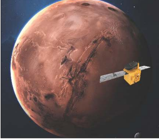
الدخول إلى مدار المريخ سيكون أصعب مراحل مهمة مسبار الأمل