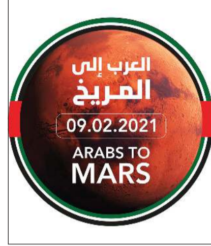
العرب إلى المريخ