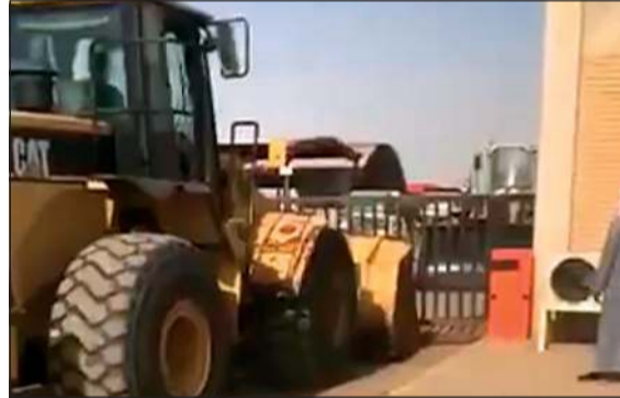
المصنع خلال إزالته من قبل آليات البلدية

يعوق عمل اللجنة في الممر المؤدي إلى المصنع، وعلى الفور تم توجيه دوريات من الأمن إلى موقع المصنع المخالف لتقطيع المعادن، وجرت إزاحة المركبة وتمكين آليات البلدية من أداء مهام عملها.