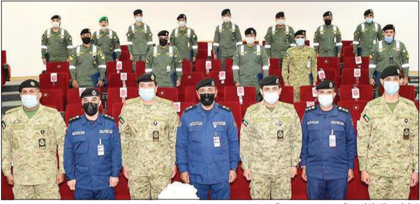
قيادات «الإطفاء» والحرس وخريجو الدورة

في إطفاء حرائق الطائرات والمنعقدة خلال الفترة من 17 يناير وحتى 4 فبراير 2021، وذلك تفعيلًا لبروتوكول التعاون المشترك بين قوة الإطفاء العام والحرس الوطني. حضر حفل التخرج عدد من قيادات التدريب في قوة الإطفاء العام وقيادات الحرس الوطني.