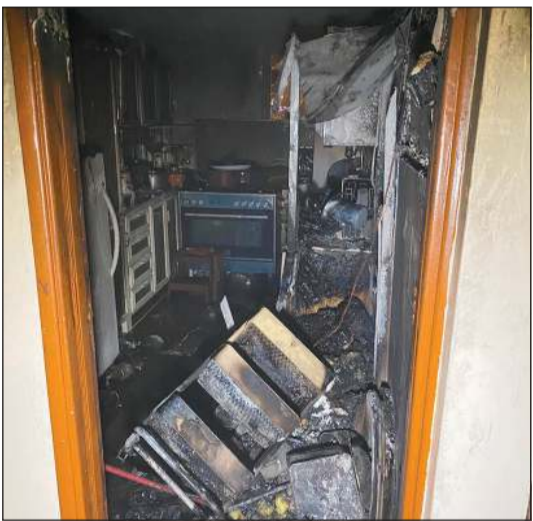
محتويات الشقة لحقت بها أضرار بالغة

تمكنت فرق قوة الإطفاء العام من السيطرة على حريق اندلع في عمارة بمنطقة حولي. وأوضحت إدارة العلاقات العامة والإعلام بقوة الإطفاء العام، أن الحريق نشب في مطبخ شقة بالدور الثاني وتعاملت معه فرق قوة الإطفاء من مراكز حولي والسالمية بعدما قامت بإخلاء العمارة من السكان دون أن يتسبب الحادث في أي إصابات. وقد حضر بموقع الحادث رجال الداخلية وفرق الطوارئ الطبية.