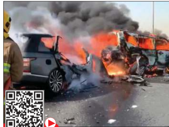
رجل إطفاء خلال السيطرة على حريق المركبتين

نحو السادسة من صباح امس بلاغاً بانقلاب باص على طريق الدائري السادس مقابل منطقة الشهداء وعلى الفور انتقل إلى موقع البلاغ رجال الأمن وتبينت وفاة شخص لم يعثر معه على إثبات فيما أصيب 4 وأقدين جميعهم من الجنسية الهندية بكسور وجروح وجري نقلهم إلى العلاج في مستشفى الفروانية بواسطة سيارات الطوارئ الطبية. وحول الحادث الثاني قال المصدر إن بلاغاً ورد إلى عمليات الداخلية نحو الثامنة من صباح امس على طريق السالمي