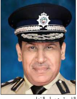
الفريق عصام النهام

أصدر وكيل وزارة الداخلية الفريق عصام النهام تعميماً يقضي بالالتزام بجميع منتسبي وزارة الداخلية (عسكريين - مدنيين - مهنيين) بالإجراءات والتدابير الصحية والوقائية التي أقرتها وزارة الصحة عند تعاملهم أو اختلاطهم مع الغير في جميع الأماكن لمواجهة انتشار فيروس كورونا المستجد. ونكرت الإدارة العامة للعلاقات والإعلام الأمني بوزارة الداخلية، في بيان لها، أن التعميم يأتي تنفيذاً لقرارات مجلس الوزراء، ونظراً للوضع الوبائي الصحي الإقليمي وتداعيات الإجراءات المترتبة على انتشار الإصابة بفيروس «كوفيد-19» وتعزيز الأمن الصحي بالبلاد.