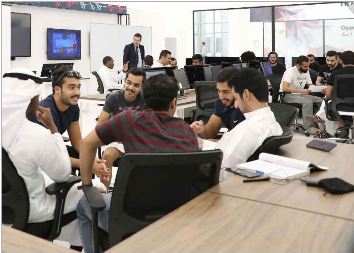
بيئة تعليمية متطورة