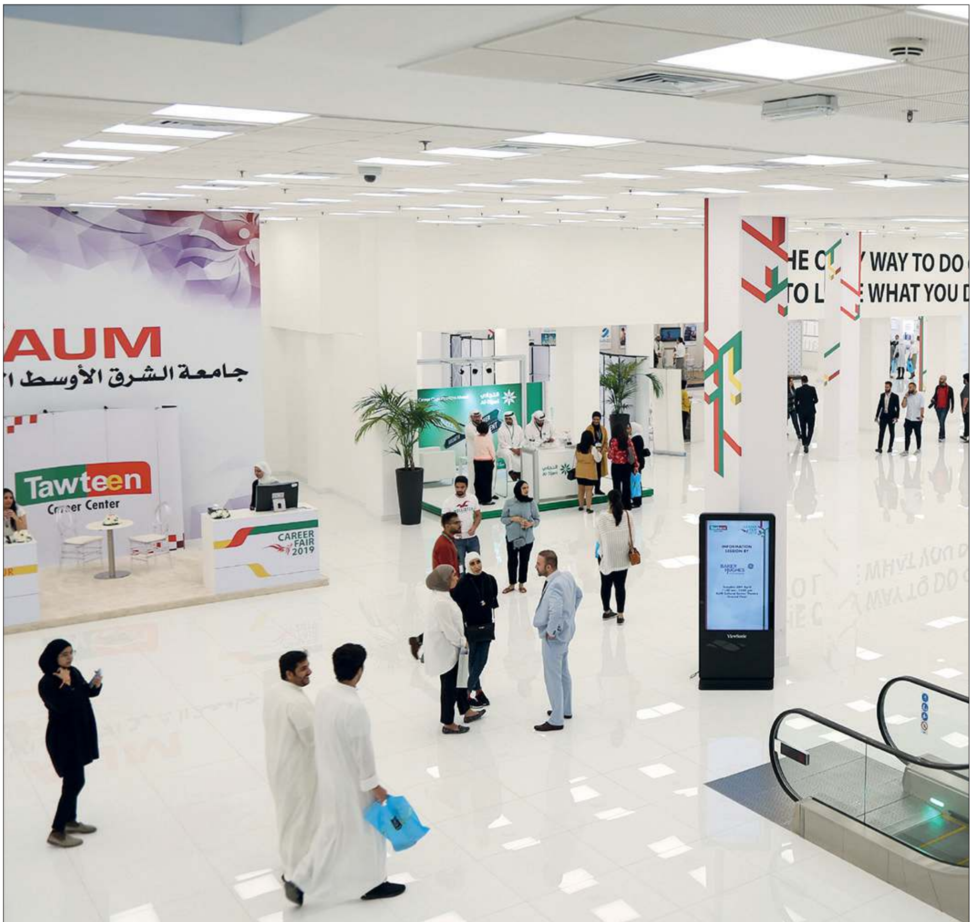
المعرض الوظيفي في AUM

ويعتمد تقييم QS Stars، الذي تقوم به وحدة Intelligence Unit في مؤسسة QS، على الدقة والتفصيل في تقييم الأداء المتميز للجامعات ومواصفاتها، مرتكزا على معايير تقييم مختلفة مثل جودة التعليم، توظيف الخريجين، بيئة التعليم داخل الحرم الجامعي، التعليم عبر الأونلاين، الطابع العالمي، وشمولية الاهتمام بالطلبة. ويتم تقييم الجامعات من 0 إلى 5 نجوم وفقاً لمعايير محددة ولعدد إجمالي للنقاط التي تحققها الجامعة أثناء التقييم. وقد استغرقت عملية التقييم في AUM نحو أربعة أشهر وارتكزت على جمع العديد من المؤشرات الخاصة بكل معيار، والتي شملت: البيانات المؤسسية، نتائج استطلاعات الرأي، ترشيحات المؤسسات في سوق العمل وفقاً لاستبيان خاص تطلقه QS سنوياً، بالإضافة إلى تحليل يركز على التعليم عبر الأونلاين، قياس مدى جاهزية الحرم الجامعي لاستقبال الطلبة بما يشمل ذوي الاحتياجات الخاصة، إجراءات تطوير التعليم ودعم الطلاب، والموارد والمرافق التعليمية داخل الجامعة، بالإضافة إلى تقييم شامل لأحد البرامج الأكاديمية كنموذج لجودة التعليم حيث تم تقييم تخصص هندسة الكمبيوتر في AUM والذي نال بدوره 5 نجوم. وتكمن أهمية نتائج تقييم QS Stars في أنها تحدد التصنيف العالمي للجامعات استناداً لحضورها المتميز محلياً ودولياً، والتزامها بالعديد من المؤشرات الإيجابية والتي تحقق الريادة في كل مجالات التعليم العالي.