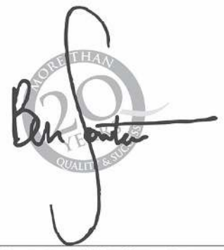
Ben Sowter - Head of QS Intelligence Unit

QS Stars™ – © 2020 QS Intelligence Unit (a division of QS Quacquarelli Symonds Ltd)