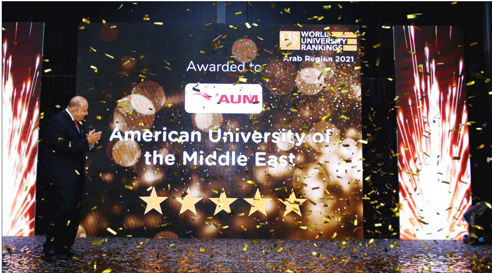
AUM تحصل على 5 نجوم في تقييم QS Stars العالمي

نجحت جامعة الشرق الأوسط الأمريكية (AUM) في الحصول على تقييم من 5 نجوم من مؤسسة «كواريلي سيموندز» - (Quacquarelli Symonds QS) العالمية. مرموقة في مجال تصنيف مؤسسات التعليم العالي (Ranking)، تأسست في بريطانيا، وتعد من أهم مراجع التقييم الجامعية على مستوى العالم.