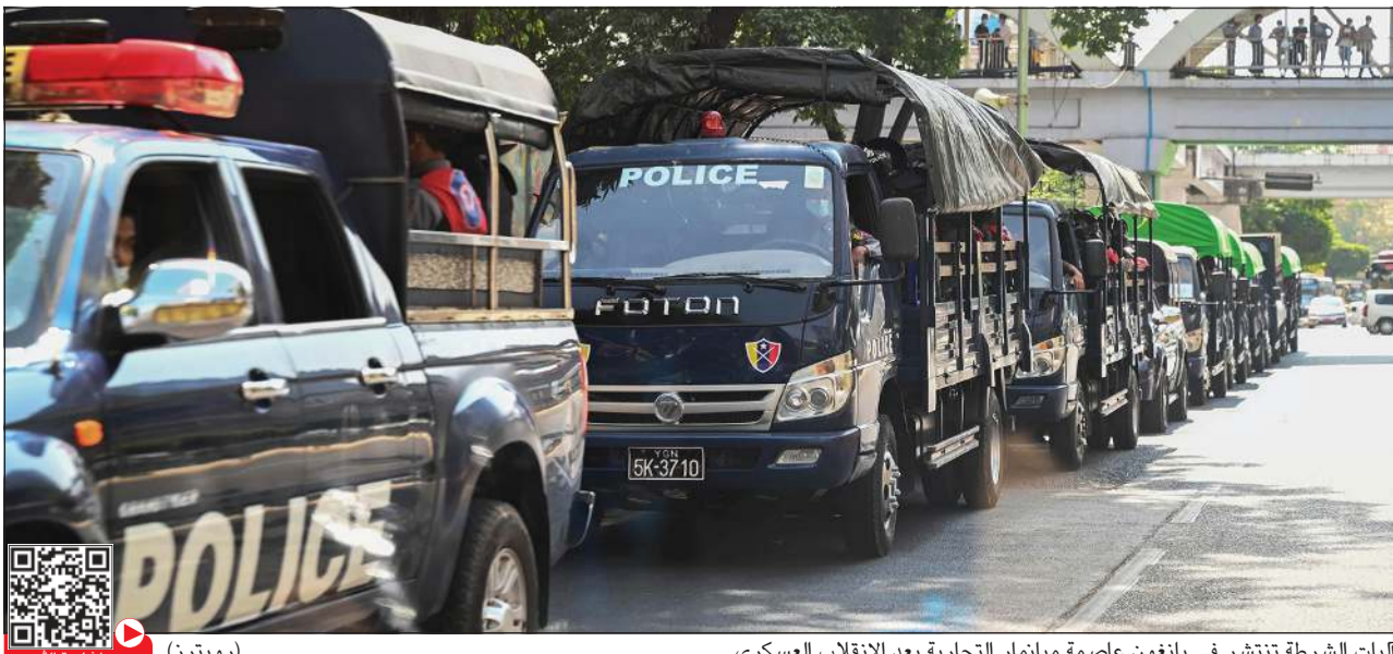
كليات الشرطة تنتشر في يانغون عاصمة ميانمار التجارية بعد الانقلاب العسكري

وأعلنوا أنهم سيسلمون الشعب.. وطالب بالإفراج السلطة بعد إجراء انتخابات الفوري ومن دون أي شروط «حرة ونزيهة».