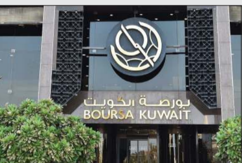
البورصة مستمرة في جذب الاستثمارات الأجنبية (متين غوزال)

هاشم: مؤسسة البرترول ستخصص نسبة من مناقضاتها وعقودها لأصحاب المشاريع الصغيرة 16