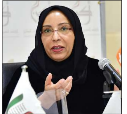
الشيخة فادية السعد