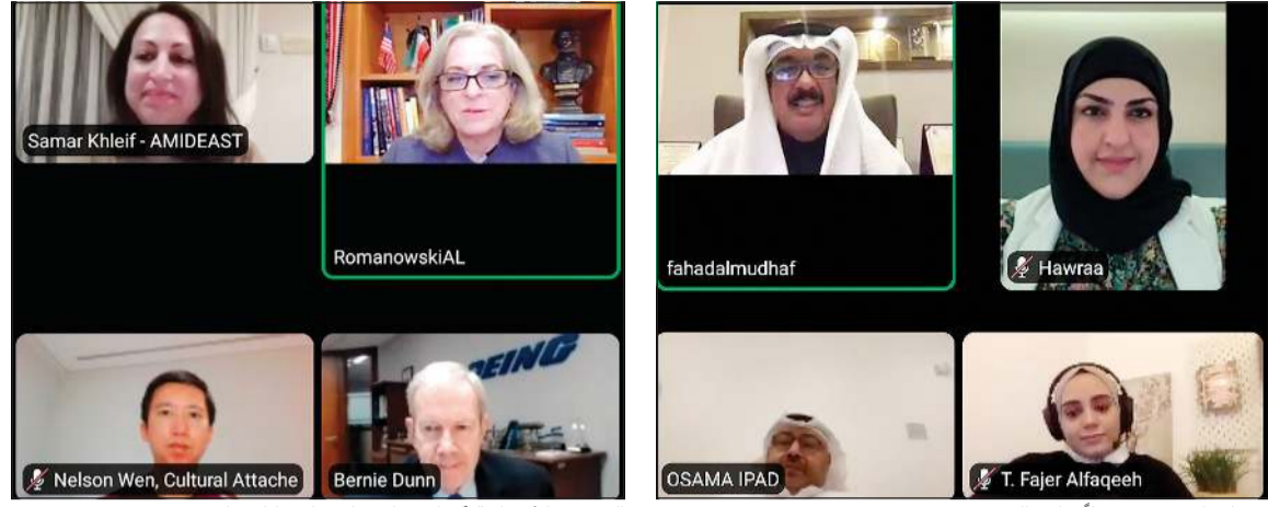
السفيرة الأميركية البنا رومانوسكي تلقي كلمتها

المصفي يعكس حرصه على أنبائه المعلمين، موضحاً أن هذا التكريم كان مستحقاً للمعلمين حيث كان البرنامج مضعوطاً جداً لكن المعلمين الكويتيين أثبتوا قدراتهم ومهاراتهم. وأشار إلى أن المشاركين أنبتوا جدارتهم وجدوى التدريب، لافتاً إلى أن التدريب الوطني في الكويت هو ما تطمح إليه الوزارة.