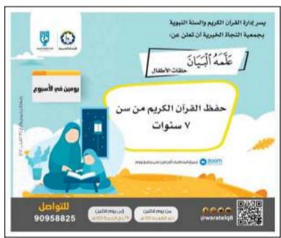
رعاية واهتمام شديداً بالأطفال