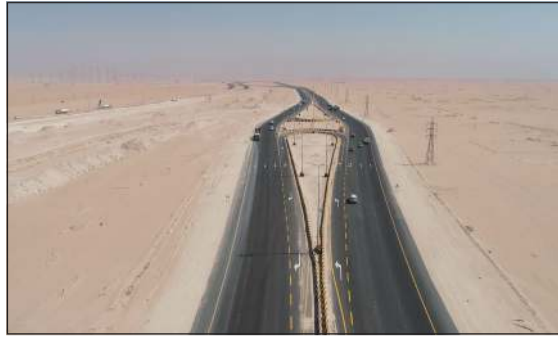
أحد أجزاء المشروع بعد إنجازه