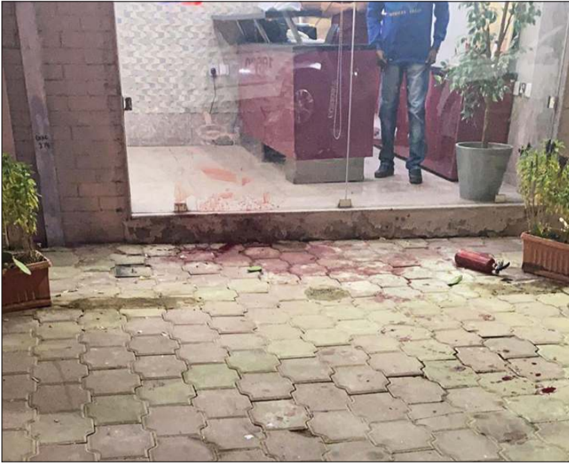
دماء القتل مقابل محل المعجنات

تبين أن الواقعة عبارة عن شجار قام المتهم خلاله بطعن المجني عليه.