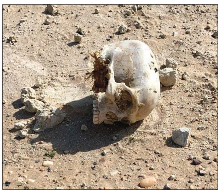
الجمجمة التي كشفت عن الجريمة