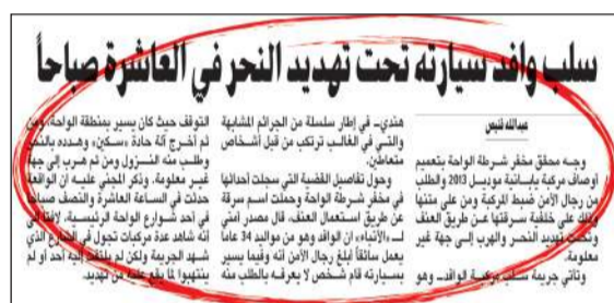
الخبر الذي نشرته «الأنباء» الخميس الماضي

مثلما حدث في قضية سرقة مركبة مسنّ داخل محطة وقود أو قضايا لأشخاص يدخلون إلى بقالات أو صيدليات ويتركونها في وضعية تشغيل. وقال مصدر أمني لـ «الأنباء» إن المتهم سيقوم بإرشاد رجال المباحث عن مواقع مركبات سرقتها وتخلص منها في أماكن مختلفة. وبحسب مصدر أمني، فإن