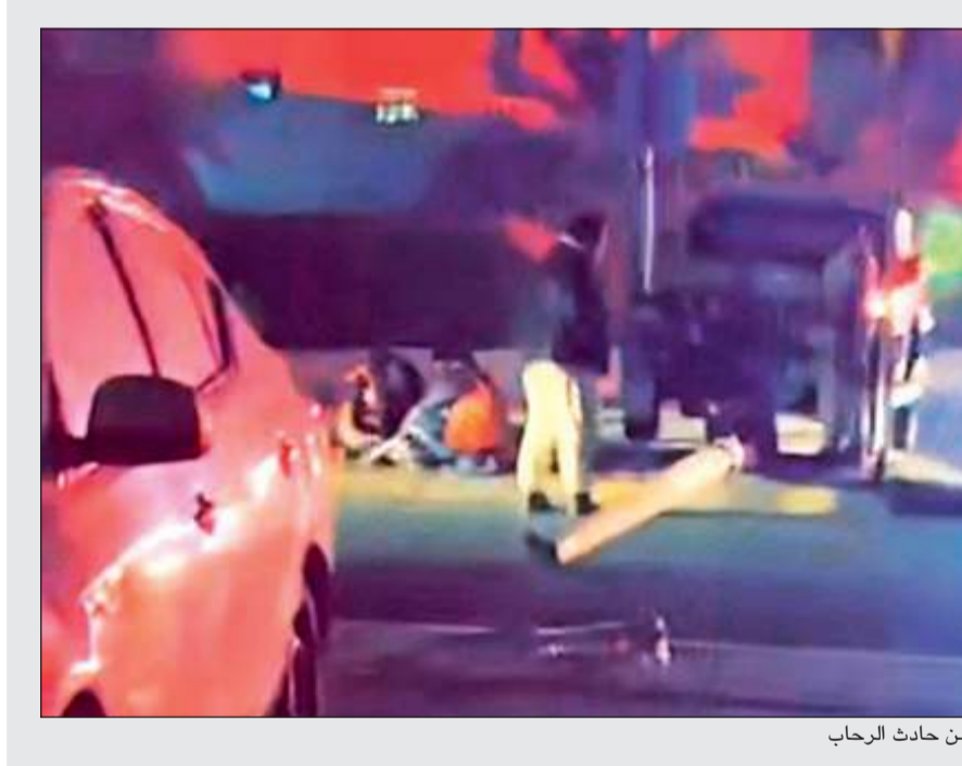
من حادث الرحاب

أقدمت وافدة نيبالية من مواليد 1967 وتعمل خادمة على الانتحار شتقاً داخل غرفة ملقحة بمنزل كفيها بمنطقة العيون، فيما أكد كفيل الوافدة لرجال الأمن عدم ملاحظته أي أعراض أو أسباب تدعو الخادمة إلى إنهاء حياتها، مؤكداً