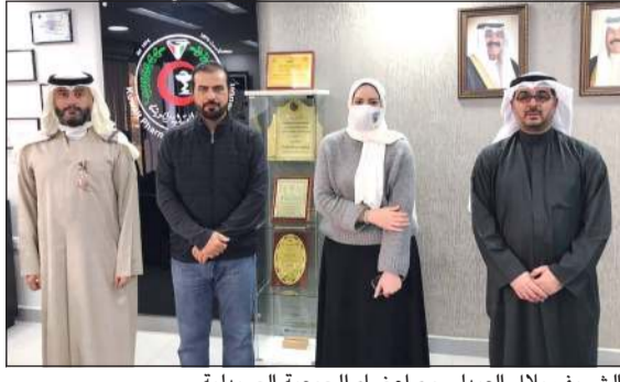
السفير بلال العبدلي مع أعضاء الجمعية الصيدلية

ناقش رئيس لجنة الصداقة الشعبية العراقية – الكويتية الشريف بلال العبدلي تفاصيل المبادرة التطوعية التي ستتم بالشراكة مع كل من الجمعية الصيدلية الكويتية والجمعية الطبية الكويتية وجمعية أطباء الإنسان الكويتية وجمعية بلد الخير ولجنة الصداقة العراقية – الكويتية الشعبية.